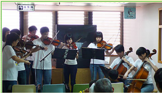
羅東博愛醫院樓層演出