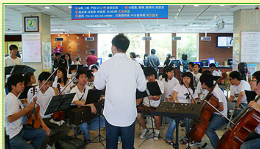
同學等等要好好演奏

此外，我們在花蓮高中演藝廳也舉辦一場較正式盛大的音樂會，提供花蓮鄉親聆賞管絃樂的機會，跳動的音符與悠揚的旋律給觀眾與我們一種心靈上的交流，讓鄉親感受到「眾樂樂」。