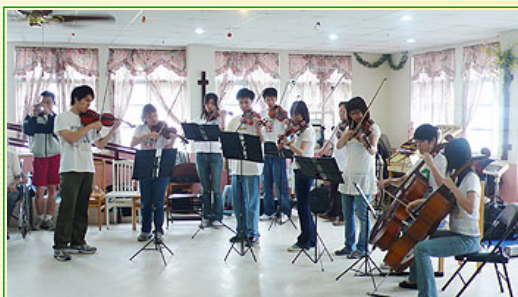
花蓮醫院護理之家演出

在陽明這個知識與學習的高塔中，頂多是在典禮的場合與一些特定的廳堂演奏展現我們的音樂，鮮少有機會可以更生活、更平凡地將音樂帶給周遭的人們，而今，透過學校與各醫院的支持，讓我們得以與醫院的員工與病友分享我們的音樂。也許我們在音樂上的技巧稱不上高超，但，能得到共鳴與感動的音樂，就是好音樂！這樣的感觸，在這趟巡演中尤其明顯，看著病友對那耳熟能詳的道地台灣小品曲的反應，有認真地側耳傾聽，有隨著節奏努力地擺動病體，更有因此勾起內心深處的回憶而熱淚盈眶的...，這一幕幕景象深深地烙於我心，也因為這份感觸，不僅自己連日來的疲累一掃而空，也讓自己更肯定對音樂的執著，快樂不過就這麼一回事嗎？