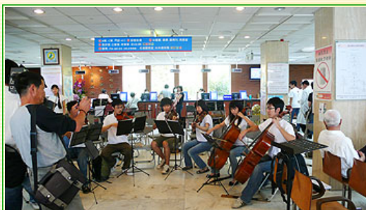
附設醫院演出花絮