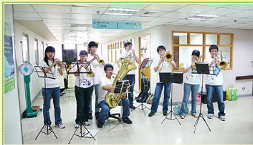
羅東博愛醫院演出

隨著最後一個音符落下，愛杏東巡的活動告一段落。畢竟是自己親自參與策劃的活動，心頭重擔自是減輕不少。細嚼這數場表演，大部分過於瑣碎的細節難以一一回憶，但在我腦海中揮之不去的，是一份心頭裡的震撼，及身為陽明人的驕傲感。