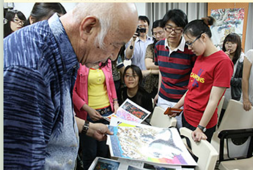
楊大師請同學們直接觀賞以前學生作品並實際演練

會場中佈置了許多楊大師的繪作，大師摒棄了數位簡報的方式，用真實大家一起創作的方式，讓現場同學了解到其實美學並不難，只要你勇於嘗試，拿起畫筆，就有自我獨特的風格與韻味存在。