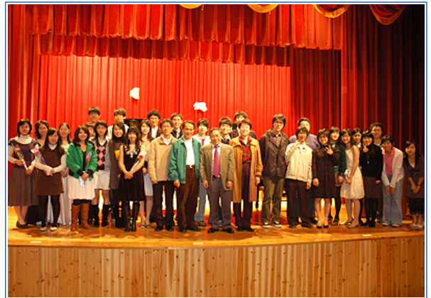
演奏會後所有演出同學大合照