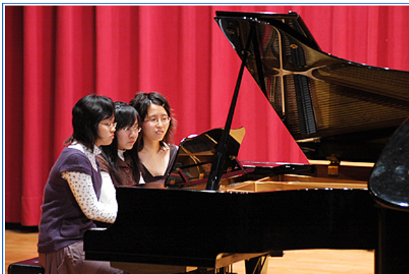
同學賣力的演奏六手連彈