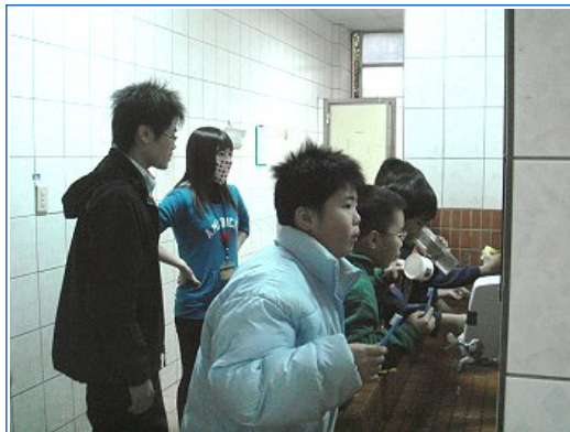
小朋友練習正確刷牙法

禮堂裡1小時的團體衛教之後，15個班級的小朋友由班導師各自帶回教室，口衛隊同學則兵分15路，分散到各班教室進行實際演練。有的個別指導使用牙線的技巧、有的利用海報宣導衛教知識、有的拿著大假牙教小朋友正確刷牙的方法、有的帶小朋友拿著牙刷到洗手台實際練習正確刷牙方法。教室走廊上，嘈雜好動的小朋友竄來竄去，其間穿梭著一群來自大學的大哥哥大姐姐，口衛隊的活動，可成為本校推展教育部「大專校院帶動中小學社團發展」的可行模式之一！