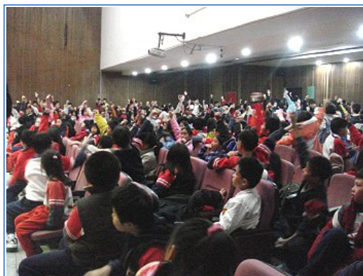
現場有獎徵答，小朋友踴躍搶答