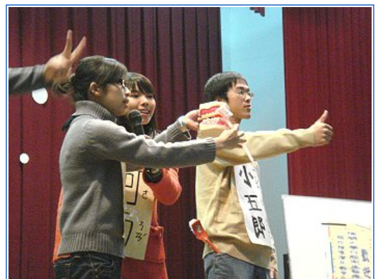
口衛隊同學扮演卡通人物 - 柯南，教導小朋友如何正確刷牙