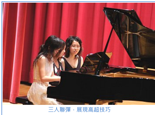
三人聯彈，展現高超技巧

過了週末，緊接著由清大接力登場。上半場主要是個人曲目，下半場則全部由聯彈和雙鋼琴所組成，無論是個人在琴鍵上的自由飛舞，或者是兩人之間呼吸與眼神的交換，甚至心跳的契合，實在精采絕倫。一場音樂會聽下來，觀眾們都大喊過癮。「遇鍵」由交大壓軸。比起前三場，雖然場地稍小，卻人氣不減，把演藝廳擠得水洩不通，台上兩架史坦威名琴更顯氣勢非凡，讓表演者精湛的琴藝得以充分發揮。最終場的最後一首曲目，是流行歌曲「遇見」，遇見為孫燕姿專輯中的著名抒情音樂。松竹楊梅四校聯合音樂會名稱「遇鍵」是取自這首歌，因此傳統上都會以學長改編過的遇見，由四校前社長演出。在演出時，我們還會用歌聲帶領觀眾，為這四場音樂會帶入尾聲，將祝福傳達給所有參與這場盛會的人，期盼明年再一次的遇鍵。