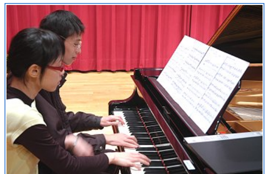
快練習才有好表現

為求完美，大家提前規劃各表演場的所有細節，包括宣傳、主持、曲目順序、舞台佈置，以及當天的所有工作分配（獻花、攝影、燈控）等，深怕有任何閃失，讓在場觀眾失望。因為，即使只有一位觀眾覺得不夠好，也將會是我們很大的遺憾。為了盡量避免這種狀況發生，我們無時不刻在心中不斷演練