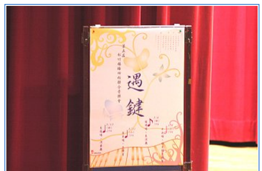
第五屆四校聯合音樂會 - 遇鍵