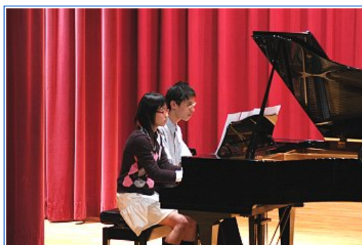
四手聯彈，表現兩人的默契

如果說活動中我最害怕發生什麼，可絕不是表演者彈錯或忘譜，因為我信任大家的努力與呈現。其實，作為主辦者，我最怕在音樂會要接近開始時，才聽到友校表演者還在路上，說才剛下課或才要搭火車或客運趕過來的消息。雖然平時有台聯大專車可以直達其他學校，但有時卻不順路，或者發車時間不符合，只好改搭客運，都讓主辦場的同學心裡上上下下，表演者的演奏心情也大受影響。幸好這次松竹楊梅雖然偶有意外，最後都能順利到達並且給予觀眾完美的表演，總算是萬幸。