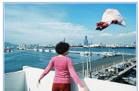
「深海」劇中人安姐位於旗津大汕頭漁港的家，頂樓可以遠眺高雄港及高雄八五大樓等城市景觀。