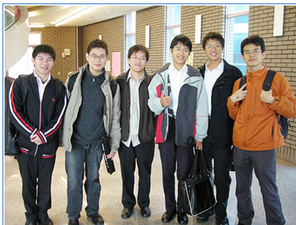
口琴社表演者6人合照