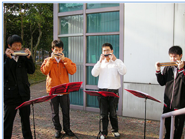
表演前的加緊練習