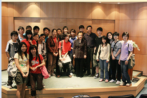
與聽講學生留影紀念