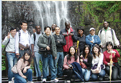
五峰旗瀑布前合影

首先到達的是五峰旗瀑布風景區，循著區內登山步道石階的小徑，沿途林蔭、景色優美，走起雖然氣喘吁吁卻是充滿喜悅。五峰旗瀑布位於為宜蘭縣礁溪鄉，瀑布後面有五座尖峰並列，就好像是國劇裡武將軍背後的五支三角旗一般，故而得名「五峰旗」。山頂上終年雲霧繚繞，山泉水也不斷自山上直衝而下，形成三疊瀑布，僑生與國際學生於觀瀑亭眺望翠綠的山巒及欣賞到壁中穿出的瀑布，實際體驗蘭陽八景中「西峰爽氣」的溪豁之美。