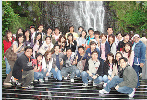
五峰旗瀑布前合影