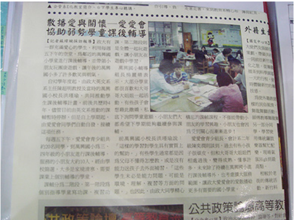
政大服務性社團「愛愛會」，為經濟弱勢國小學童免費課輔

好不容易看完服務性社團，時間當然已經嚴重delay，不意外地，我直接省下中午用餐時間繼續奮鬥，以不忝為評鑑委員的責任，更勿枉社團同學們平日的努力與成果，及參加社團評鑑當天擺攤解說的辛勞。猶帶著看完服務性社團之後小小澎湃與激昂的心情，相較之下，以我個人的評分觀點來說，體能性社團就比較容易相形見绌囉。不過，體能性社團「做為1個類別」，我仍努力為大家評出高下。政大體能性社團中，包括國術、太極、劍道、網球等相當於本校運動性社團者，加上國標、熱舞、民族舞蹈等相當於本校康樂性社團者，另外還有瑜珈、有氧、滑板、單車、弓道、啦啦隊等五花八門的「興趣團體」。這一類社團，以其活動內容及型態，被我個人歸納為兩小類：第一小類，是以練技術、參加各項競賽拿獎牌為「職志」者，例如：柔道、跆拳道、桌球等社，其活動內容相對較為靜態、較缺乏豐富性，有的甚至是為與校隊結合的社團；第二小類，則因加入社會服務的元素，而增添活動內容的多樣性，例如：民族舞蹈社到政大實小教小朋友跳民舞、瑜珈社開放社區居民參與上課、單車社到偏遠部落幫原住民修理單車、國標社受邀為企業或政府機構表演等等，對第二小類社團而言，參與社會服務，就是加分的重點了！