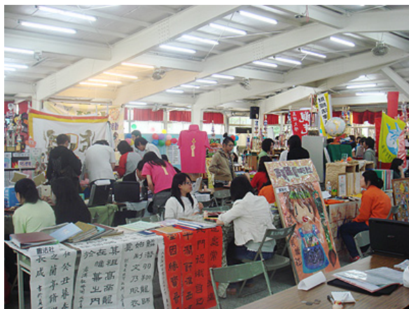
真理大學社團評鑑現場，社團攤位五花八門

綜合今年3月份的政大、真理大學社團評鑑，以及去年4月參與的台大社團評鑑，大體而言，各校（及全台大專院校）的評鑑是以擺攤解說的方式進行為主，而這也是教育部主辦之全國大專院校績優社團評鑑的評鑑方式。擺攤解說方式有其優點，社團依其創意及願意投注評鑑活動的程度佈置攤位，展現一年來的活動成果，包括書面資料、獎牌獎盃、成果照片等等；然其缺點則是，評鑑委員實難於短短不到10分鐘「判生死」，斷定各社團之優劣。