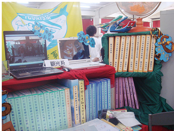
真理大學觀光系系學會書面資料豐富翔實

至於評鑑的項目，各校有自製的評分表，但大致與教育部大專院校評鑑標準表的項目大綱出入不大，大多涵蓋：組織運作、檔案資料保存、財務管理、活動績效等。教育部於去年9月函送修正之全國大專院校社團評鑑評分標準表，特別將原本15%的「帶動中小學社團發展、社區服務」評分項目，改為「服務學習」，強調引導社團活動依服務學習之步驟及理念，如：設計、規劃、執行、評量、互惠、反思等，將服務學習的元素加入社團活動；此外，新增5%的「外加分數」－社團特色及溫馨故事。由此，我們可將社團評鑑的項目視為一個引導性指標－引導學生社團朝向「強調服務」、「發展社團特色」的方向。