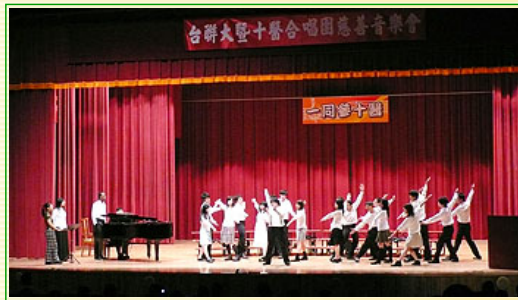
清大合唱團生動的演出