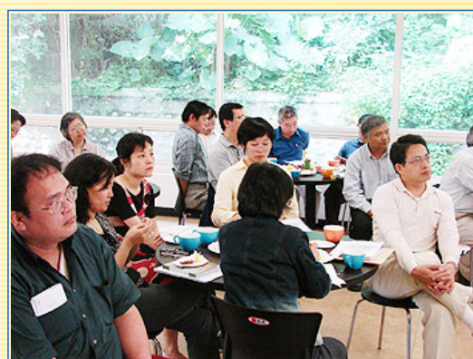
感謝導師們熱烈捧場