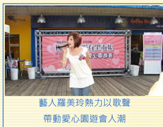
藝人羅美玲熱力以歌聲帶動愛心園遊會人潮