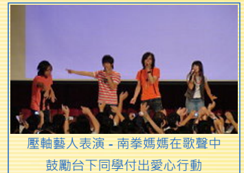
壓軸藝人表演-南拳媽媽在歌聲中鼓勵台下同學付出愛心行動