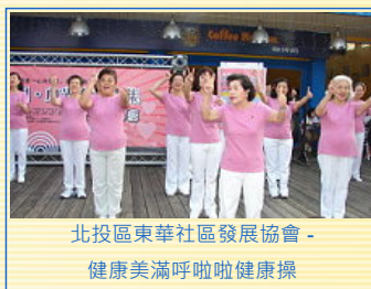
北投區東華社區發展協會-健康美滿呼啦啦健康操

10月25日（六）的午後4時，陽明生活廣場擠滿了四面八方帶著愛心前來挖寶的人潮，14個攤位正以濃厚的人情味賣出一份份的愛心，來自北投區東華社區發展協會的環保養生餐及環保手工皂、永欣里的精品服飾、榮光里的滷味、綠豆湯及仙草湯、吉利里的客家麻糬、吉慶里的炒米粉與貢丸