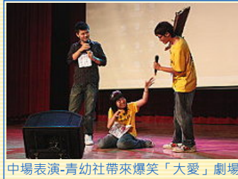
中場表演-青幼社帶來爆笑「大愛」劇場

中場青幼社帶來具有「大愛」意義的表演，帶動大家的愛心；口琴社則以輕快的三首曲子帶出台下師生的熱烈掌聲。