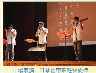
中場表演-口琴社帶來輕快旋律

「南拳媽媽」共同見證陽明人的愛心，並藉其公眾人物影響力，在歌聲中鼓勵大家舉手之勞做愛心。晚會則在南拳媽媽精湛的表演中劃下句點，愛的火炬仍未熄滅，滿載著社區愛心的園遊會即將於10月25日熱鬧登場。