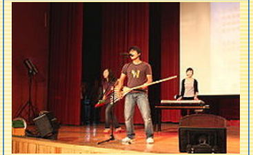
研究生學生會帶來神秘拍品-精采戲劇表演