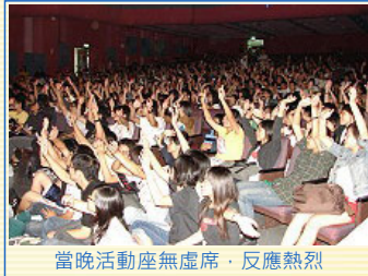
當晚活動座無虛席，反應熱烈