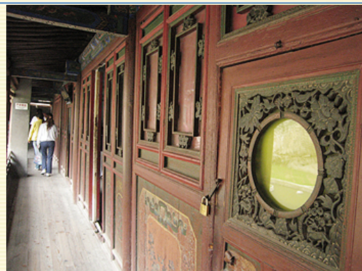
室外門廊狹窄，因年代久遠，腳下木板吱吱作響，心中難免緊張