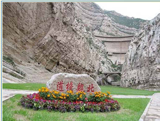
懸空寺就建築在這萬仞絕壁的北魏古棧道上