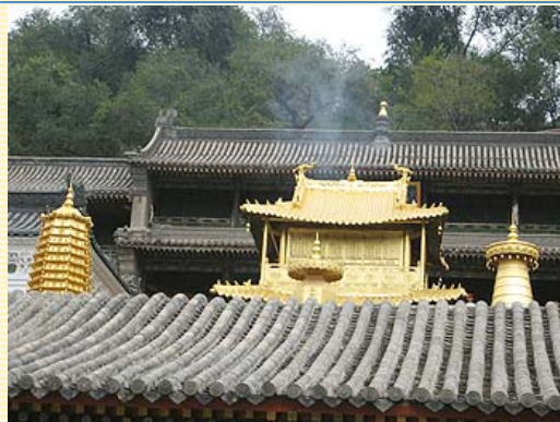
銅殿，建於明代，高3米，重達五萬公斤，殿中央供奉高約一米的銅佛，周圍壁上鑄滿小佛像萬尊，裝飾富麗，銅殿前有銅塔、銅鐘

懸空寺內有樓閣殿宇40間，建於萬仞絕壁的古棧道上，建築依山成弧形狀，是個不受風吹、雨打、太陽曬的福地，樓閣方向朝西，行進間引導遊客往西方極樂世界，寺內銅、鐵、泥、石等雕塑共80尊，最高處的三教殿內，釋迦牟尼、老子、孔子共處一室，堪稱中國宗教史上的佳話，室外門廊路窄、柱子細，腳下木板偶爾吱吱作響，走在這懸崖峭壁的空中樓閣，難免令人寒毛聳立，但曾經歷過靈丘八級大地震，居然毫髮無傷，令人嘖嘖稱奇。