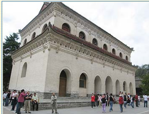
無量殿，純系磚結構建築，形制奇特

車子到達北嶽恒山腳下，眼前壯麗的北魏古棧道，令人產生思古之幽情，遠處半山腰上座落著一排秀麗、莊嚴的建築，由山腳下觀望它，如同懸掛在一幅巨大屏風腰間玲瓏剔透的玉雕，這棟創建於北魏後期的建築→懸空寺，是由十幾根柱子支撐著的，而且一撐就撐過了1400多年，如今依舊如夢似幻般漂浮於半空中。