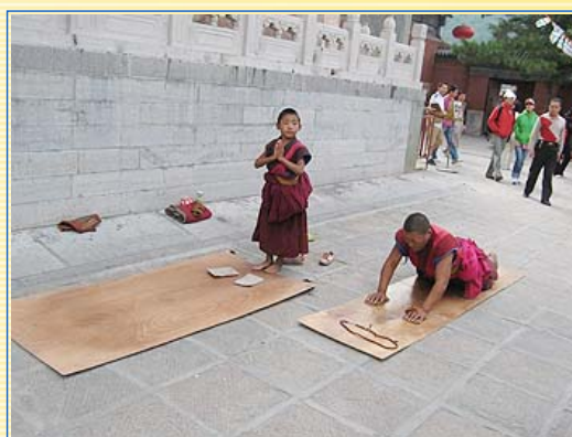
五臺山內處處可看到虔誠的喇嘛，繞著塔寺跪拜

來到寧武縣城西南20里處的一洞穴，下車前，領隊叮嚀大家穿上厚實保暖的衣服，只見各個全副武裝，魚貫進入了毫不起眼的洞穴，往地下步行不到100公尺，洞內四處冰封、寒氣逼人，繼續往前走，眼前突然出現晶瑩剔透的冰宮，內部冰柱、冰筍、冰花等景緻蔚為奇觀。洞內分上、下兩層，遊客可通過冰洞、冰梯、冰棧道到各層遊覽，洞內愈深入冰層愈厚，冰層不因季節而變化，即使外面是炎炎夏日，洞內冰層依舊不消融。據專家研究，目前該地自然環境，尚未發現形成冰洞內冰層的條件（通常是南、北極才可能形成的景觀），所以，寧武冰洞是個大自然之謎。