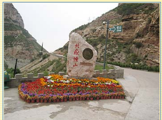
從此處上行兩公里，就可到達北嶽恒山