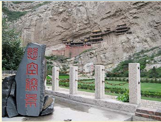
座落在半山腰上的懸空寺，遠處觀賞猶如空中閣樓，如夢幻極為特殊