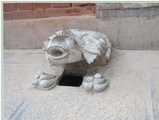
顯通寺內的排水口，造型特殊

懸空寺內有樓閣殿宇40間，建於萬仞絕壁的古棧道上，建築依山成弧形狀，是個不受風吹、雨打、太陽曬的福地，樓閣方向朝西，行進間引導遊客往西方極樂世界，寺內銅、鐵、泥、石等雕塑共80尊，最高處的三教殿內，釋迦牟尼、老子、孔子共處一室，堪稱中國宗教史上的佳話，室外門廊路窄、柱子細，腳下木板偶爾吱吱作響，走在這懸崖峭壁的空中樓閣，難免令人寒毛聳立，但曾經歷過靈丘八級大地震，居然毫髮無傷，令人嘖嘖稱奇。