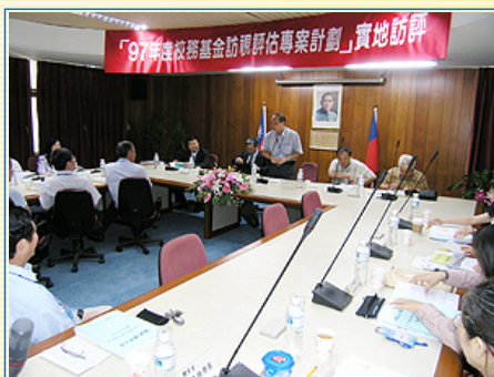
訪視委員及本校主管相互介紹

教育部為瞭解國立大學校院校務基金運作之實務與特色，協助各校健全校務基金運作，並提昇其對於校務發展之效益，特別委託社團法人台灣評鑑協會赴各國立大學進行訪視評估，以檢視現行校務基金實施的相關制度、法規與運作等問題，同時蒐集各校對校務基金設置規範與實施之發展建言，提供教育部制訂政策之參考。根據抽籤結果，本校為綜合大學一組之第一個接受訪視之國立大學。