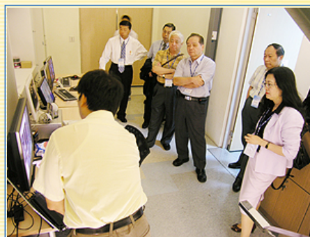
訪視委員們對fMRI核心設施對腦神經的探索深感興趣

校長非常感謝所有參與及協助訪評行程的教職同仁，大家盡心盡力、主動積極的表現，正具體的呈現出本校務實的特色，同時也留給訪視委員們極為深刻的印象。