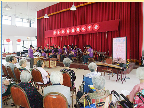
老爺爺老奶奶聚精會神的聆聽兩校同學的演奏