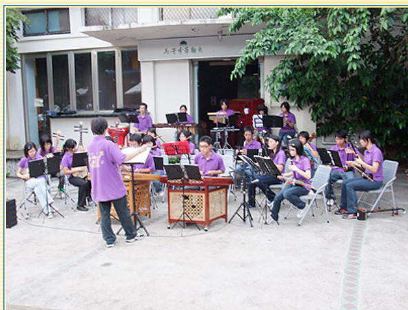
表演同學在山下廣場的實力演出