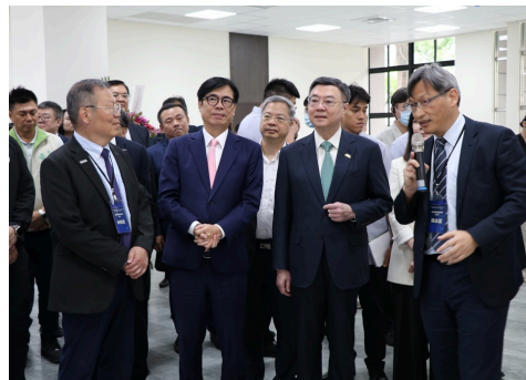
林奇宏校長與陳永富副校長向行政院長卓榮泰及高雄市長陳其邁介紹環境。