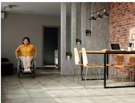
超高齡社會住宅設計