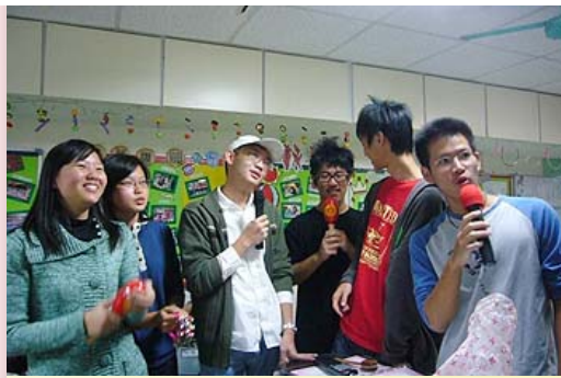
同學們到養老院獻唱