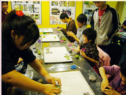
教小朋友做手工餅乾

時值期末，971學期的服務學習活動大部分都已告一段落。這是本校第一次實施服務學習活動，回想學期初始，導師、學生、課輔組及服務機構都需要密切的來回聯繫及確認，但隨著同學選擇服務地點及內容的確定，及與服務機構的溝通協調，漸漸地，服務學習活動大多就緒，且同學也都已陸續提供服務。