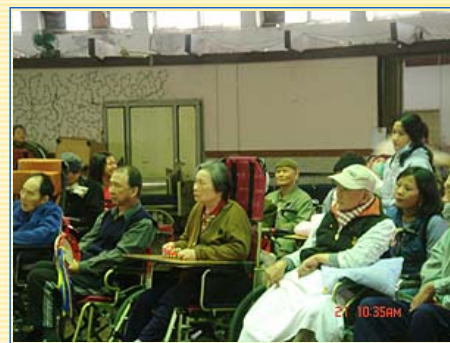
演出時觀眾陶醉其中

意外的是，姑且不論大家是否喜歡四行譜，最後一天在振興醫院護理之家的成果發表會，我看到了出我意料的結果。由於這次四行譜的選曲主要偏重的是老人家熟悉的「茉莉花」、「思想起」、「小城故事」，還有熱熱鬧鬧的「草螟弄雞公」、「喜洋洋」、「農村酒歌」，反而讓我們在成發的過程中，不只是我們自己在表演，台下的觀眾們也因為聽到了熟悉的旋律，而能跟我們有互動，甚至有老奶奶在護理人員將麥克風遞到她面前時唱出了「好一朵美麗的茉莉花」。當我看到這一幕時，我不禁微笑了。我想我們成發的目的除了是要展現我們在營期間練習的成果，選擇在類似這樣的安養中心表演，我們更要有個想法是，我們是要去帶給那些住民更多的生活娛樂，所以不僅僅是我們在台上要開開心心地表演，更還要能讓台下的觀眾因為我們的音樂而開心。