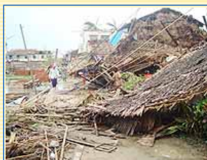
這一片片的茅草 原本是一棟棟溫暖的家園