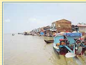
這不是水上人家的美景 而是水災黃水瀰漫 原本的陸地早已消失