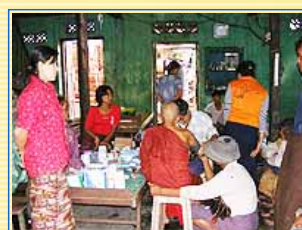
醫療團隊正在為居民檢查身體