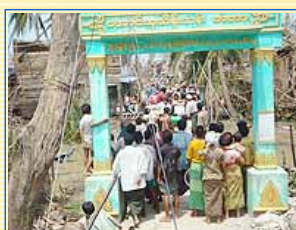
倖存的居民排隊領取物資