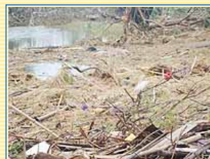
水災過後的滿目瘡痍