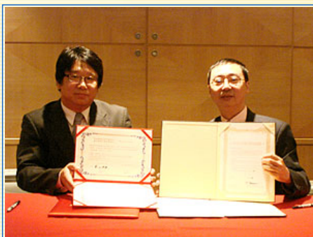
陽明大學牙醫學院與日本新潟大學牙醫學院 互換簽約協定書

新潟大學齒科部坐落於新潟市中心，與醫學部相鄰，在這裡除了提供教學外也提供相當完善的醫療。新潟齒科大學及其醫院在新潟市中心附近，病院規模龐大，病人絡繹不絕。新潟大學齒科部是全日本29所齒科部或齒科大學中排名第7的國立齒科大學，尤其矯正和病理為其強項。新潟大學齒科部的每一年級的學生人數與陽明牙醫系差不多，約四十多人上下，而且也是六年的學程；學校方面在臨床結合教學上提供很豐富的資源。齒科部有獨棟大樓，一樓、二樓為齒科病院和齒科大學辦公室，以上則是學生教室、社團系學會辦公室、教授辦公室、PBL教室等，並且整棟建築可與其他醫科病院相連接。