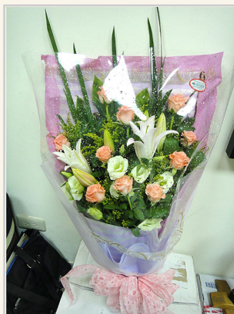
導生組獻感謝花束