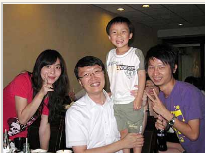
宋老師常帶著寶貝兒子出席導生活動