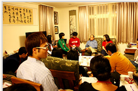
同學們熱烈地與校長交換意見

這讓當時在場的我很感動，校長以自己做了「尊重他人」的最好示範。學生們在大學校園中所應要學習的不就是這種風範和終身受用的尊重他人的態度？梁校長在不自覺的情況，為當天與會的所有人上了最好的一課！