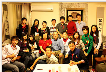
3個半小時的座談結束後，大家開心地合照

陽明人耐心等待八個多月後，今年八月上任的梁校長，果然給陽明師生新的感受，一種不同以往的師生互動，已悄悄開展。