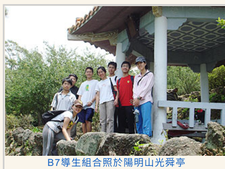
B7導生組合照於陽明山光舜亭

我們師生一行人就這樣扶靠在小小的亭子圍欄上，聽老師講述著盧醫師的事蹟，討論可以到哪裡尋找資源？該如何拼湊出這位已被許多人淡忘的良醫的一生？接近中午陽光開始辣了起來，亮熾熾地灑進亭裡的每個角落。我們走到亭外的一小方空地，再往外邊就是山崖，老師指著遠方榮總與陽明大學的方向，說兩座紀念亭面對的正是這兩位醫師一生最掛念的地方。