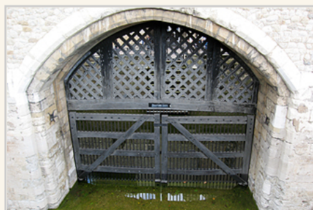
倫敦塔監獄時期，死刑犯船進入倫敦塔的叛徒門

另外，傳說在倫敦塔理會出現的幽靈，也相當有名，他們大多都跟王室的血腥篡位有關。像1483