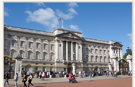
白金漢宮，是一座位於倫敦的英王寢宮

來到倫敦絕對不可錯過參觀大英博物館行程，除了它是免費自由參觀外，更重要的是它有龐大豐富的展品，它是世界上規模最大、最著名的博物館之一，成立於1753年。