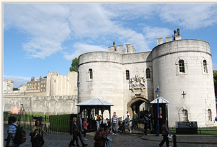
敦塔900年歷史中，曾為城堡、王宮、監獄， 產生許多精彩懸疑的故事

年，年僅十二歲就登基的愛德華五世和他的弟弟約克公爵，就被他們狠心的叔父幽禁在倫敦塔，且被暗殺，他們兩個的靈魂，至今還不甘心的在塔內徘徊。