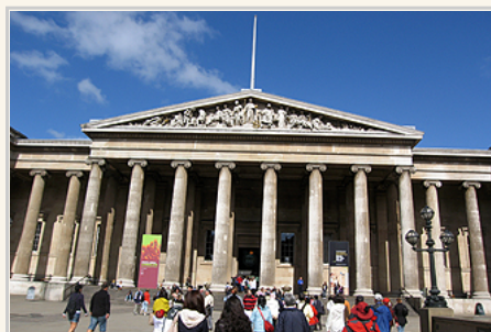
世界上規模最大、最著名博物館之一的大英博物館

博物館擁有藏品1300多萬件。由於空間的限制，目前還有大批藏品未能公開展出。博物館在1759年1月15日起正式對公眾免費開放。大英博物館目前分為10個分館：古近東館、硬幣和紀念幣館、埃及館、民族館、希臘和羅馬館、日本館、東方館、史前及歐洲館、版畫和素描館以及西亞館。展品實在太多，花了一上午的時間，只能觀賞埃及希臘和羅馬館，當然是意猶未盡。