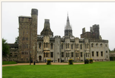
參觀卡第夫城堡的住宅區，有專人為我們導覽

旅程進入第十八天接近了尾聲，今天離開愛爾蘭乘渡輪到威爾斯，它全名「威爾斯公國」，目前的威爾斯親王就是查爾斯王子，只是掛名的君主而不具備實質的政權。