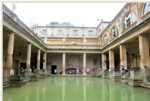
巴斯地區的古羅馬浴池博物館，地底下的溫泉，如今仍然持續湧出，令人讚嘆

羅馬浴池是西元 65 年時由羅馬人所興建的，它們導入巴斯當地自然冒出的溫泉來做水療池，而羅馬人在四百年後離去，這座大型綜合水療池也跟著荒廢，直到西元 1880 年時，這個遺跡才再次被後人所發現。大浴池池邊的階