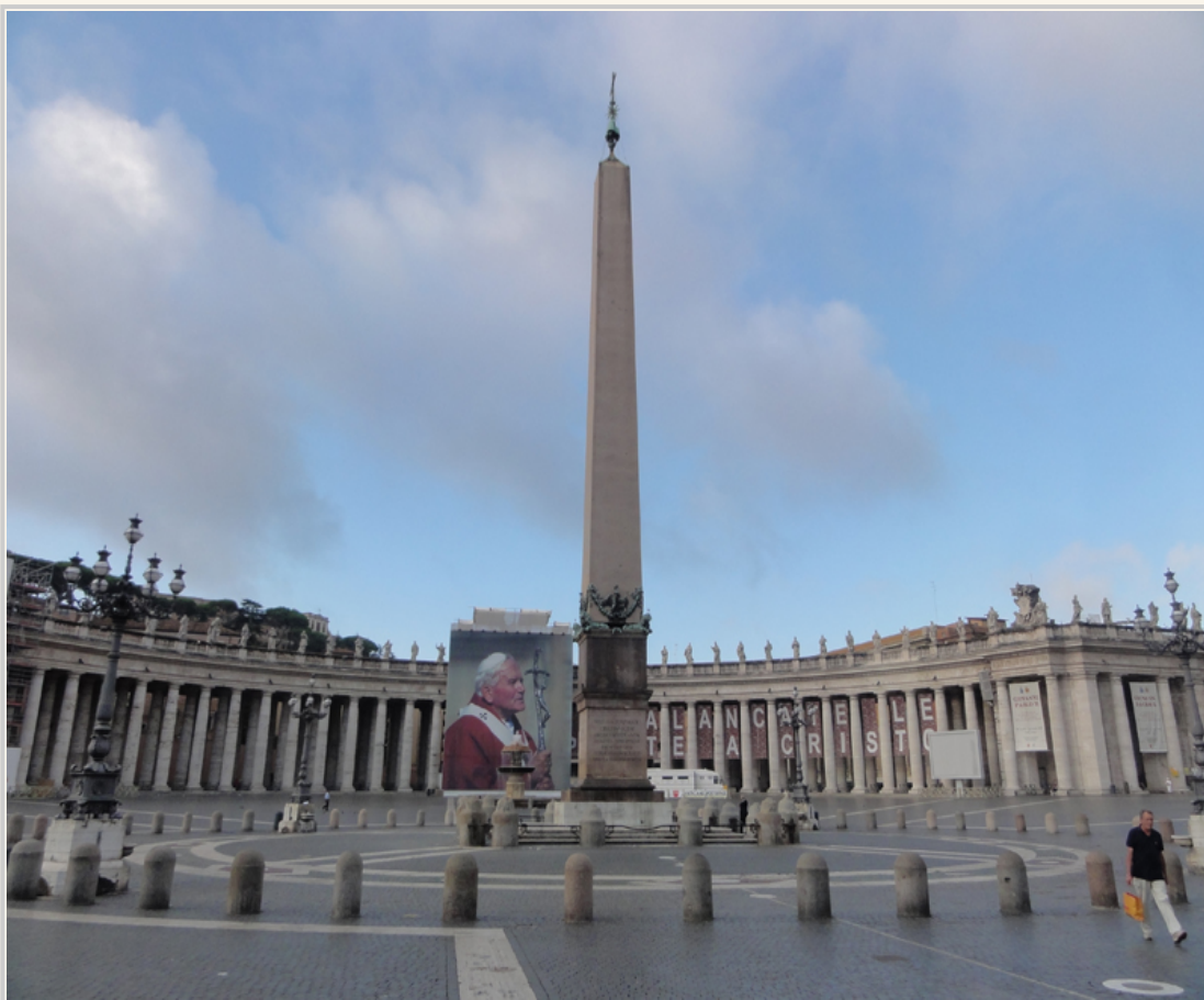
聖伯多祿廣場中央的方尖碑