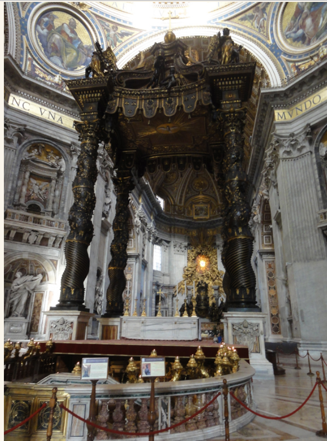
• 在拱頂的下方是主祭壇，多數的儀式由教宗在此主持