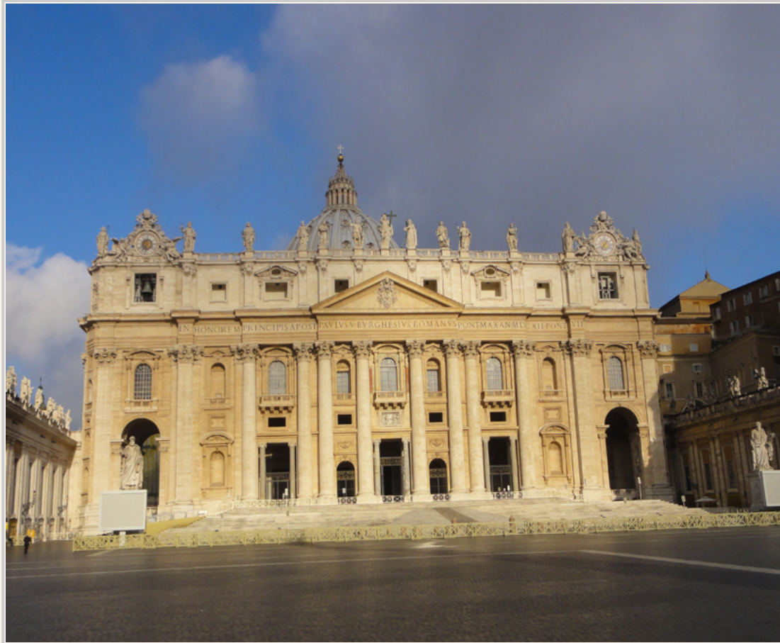
趁清晨人潮未現的時候，趕快拍整個聖伯多祿大殿