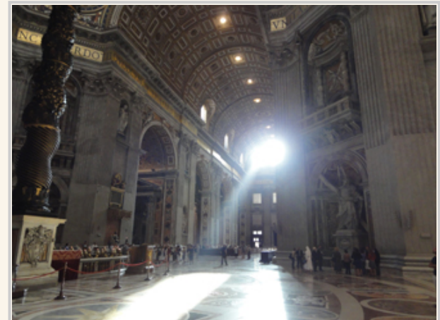
從教堂頂端照進來的雲隙光，看過去有如神蹟

一來到教廷的領土，最先踏上的就是聖伯多祿廣場。多數人因為「天使與魔鬼」這部小說或是電影，對這場景應該不陌生（動作強片「不可能的任務三」多數場景也都在梵蒂岡）。聖伯多祿廣場中央有個方尖碑，周圍就是梵蒂岡主要的建築物。這廣場的設計者就是巴洛克藝術家貝里尼，羅馬有很多的廣場跟噴水池都出自他手。一般人能參觀的建築物，主要是聖伯多祿大殿(Basilica di San Pietro in Vaticano，又稱聖彼得大教堂)。在西元1506年開始建立，在這個世界上最大的教堂裡面，最重要的瑰寶就是裡面的壁畫還有雕刻。米開朗基羅還有拉斐爾的真跡都在裡面。除了這些珍貴的遺產，裡面還有非常多的神職人員，接受信徒用各種語言告解（中文也可以使用）。除了細細品味每一個雕刻作品與「馬賽克」壁畫，看看從窗外照進來的光線，那才是另一種層次的驚奇。