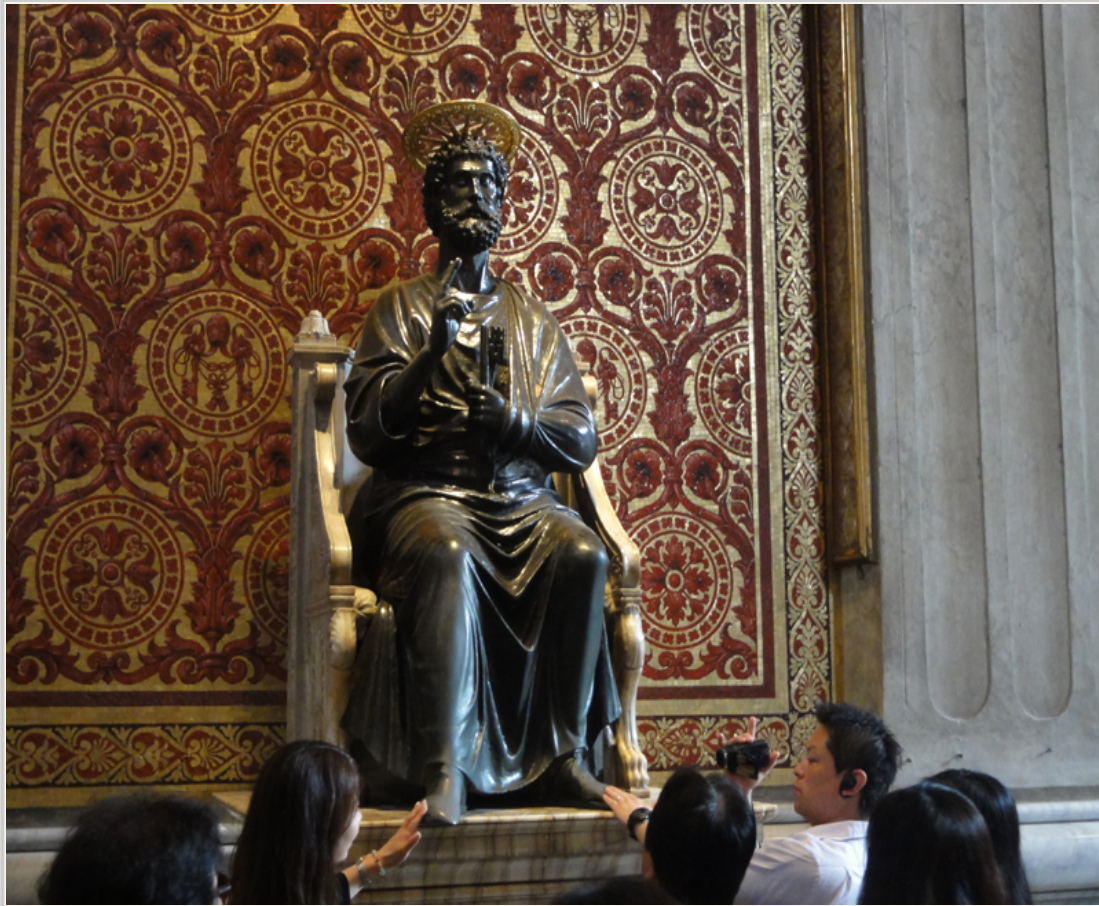
• 遊客進入聖彼得大教堂通常都會摸一下聖彼得的雕像求好運