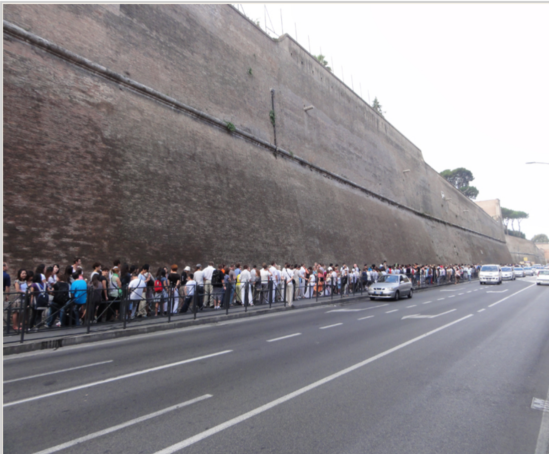
• 排隊參觀梵蒂岡博物館的人潮眾多，沒有預約，在人龍中兩個小時跑不掉