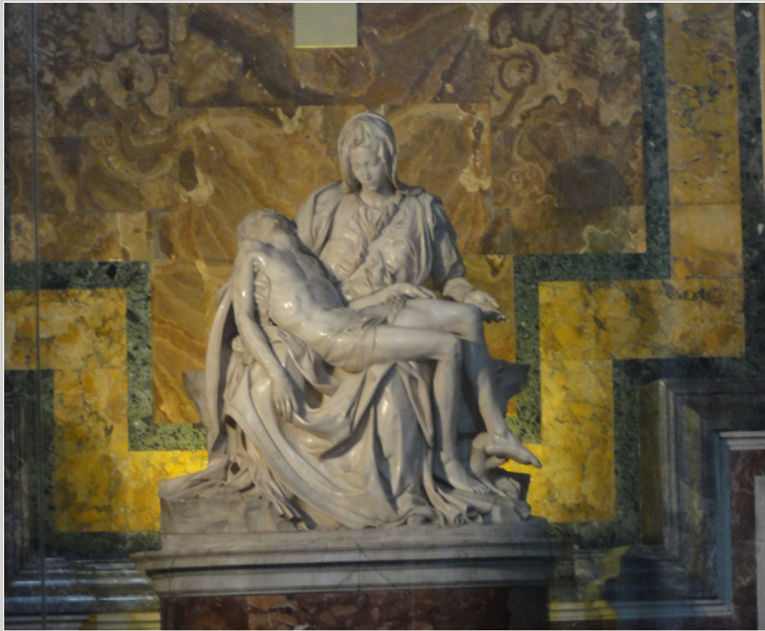
米開朗基羅的雕塑作品：聖殤(Pietà)