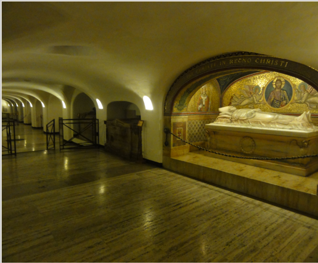
歷任教宗的墓室在地下室