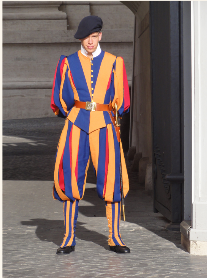
• 教廷的保全由瑞士衛隊組成，成立已經超過500年