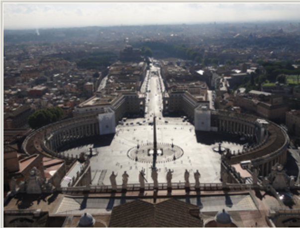
站在教堂頂端，俯瞰聖伯多祿廣場

往教堂地下室的方向前進（基本上教堂裡可以亂走，要是走到不能去的地方就有保安會阻止你），就是歷任教宗的墓室。歷任264任的主教，多數都葬在地下墓室。大致上地下室能參觀的就是這樣。如果你願意花錢，可以買門票到教堂的拱頂。當時為了省錢，選擇用走路上去，沒有買搭電梯的門票。在通往屋頂的路徑，真是越來越累人。幾乎都是很陡的樓梯，還會遇到狹窄的通道，一次只容一人穿越。夏天的羅馬非常熱，而通道又只有小小的電風扇，在通風不良的情況真是折磨人。怪不得售票處就建議老人家搭電梯，觀察一同前進的人，每個都是氣喘連連、汗流浹背。但是走到屋頂之後，剛才的辛苦（粗估要走半個小時）馬上就得到救贖：站在聖伯多祿大殿的拱頂，應該是離天堂最近的地方吧！我沒有聽到天使的聲音，但是看到了梵蒂岡與外面道路、台伯河的面貌。因為高，所以有不小的風。坐在緊連磁磚牆壁的椅子上，還真是莫名的舒服。