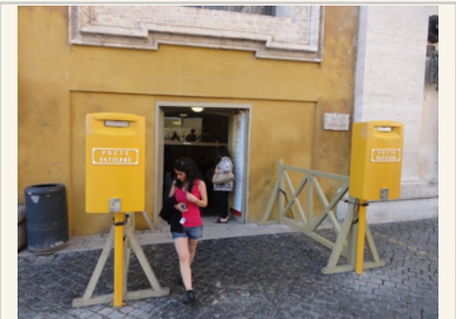
到梵蒂岡郵局寄張明信片給自己跟朋友是最好的祝福

筆者努力想要帶給大家梵蒂岡的各種風情，無奈就是少了一味。內行的讀者應該已經知道筆者少了「西斯汀禮拜堂」還有「梵蒂岡博物館」。西斯汀禮拜堂裡面最重要的就是屋頂上的壁畫「創世紀」與「最後的審判」。教宗去世之後，由樞機主教在西斯汀禮拜堂選出新任的教宗。博物館內有羅馬天主教會歷年來收集的藝術品，卡拉瓦喬(Caravaggio)、喬托(Giotto)等人