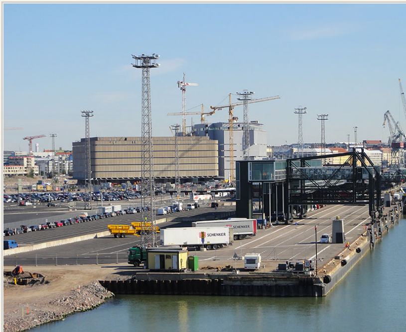
大船入港，赫爾辛基的碼頭