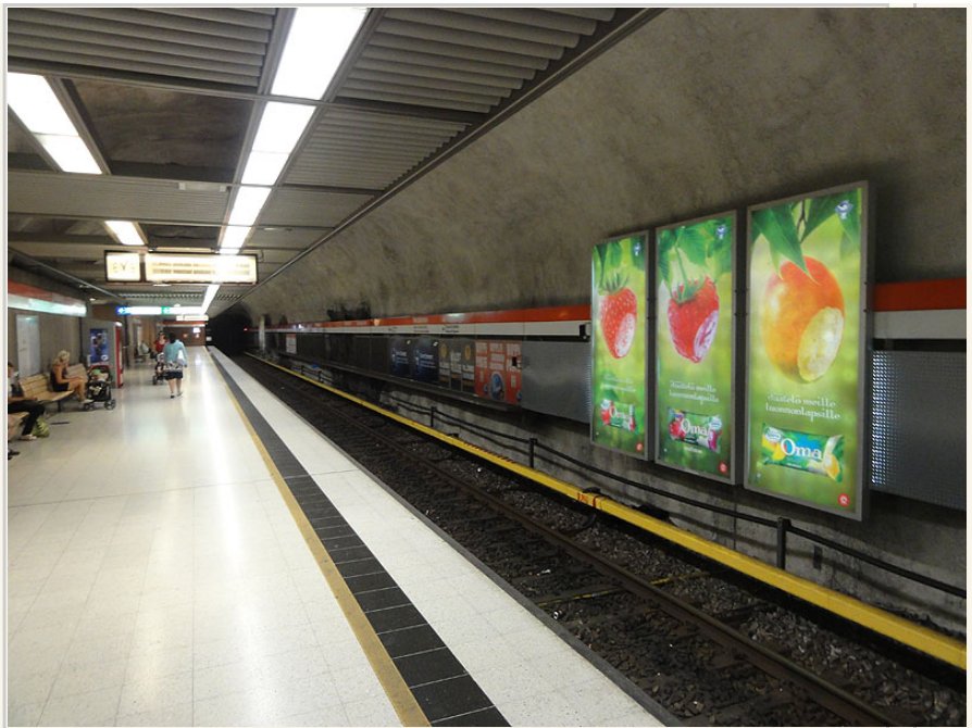
赫爾辛基地鐵站內一景