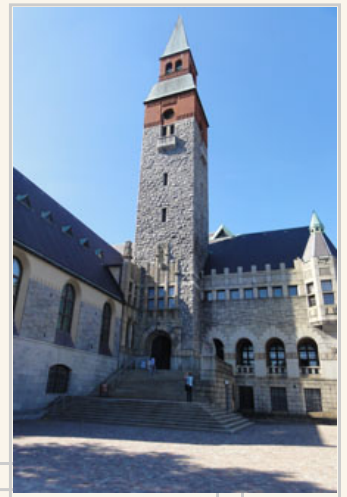
芬蘭國家博物館的入口