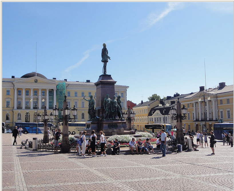
赫爾辛基教堂階梯走下來有一個雕像，這裡是議會廣場，旁邊就是舊國會大廈。繼續走可以到市集。