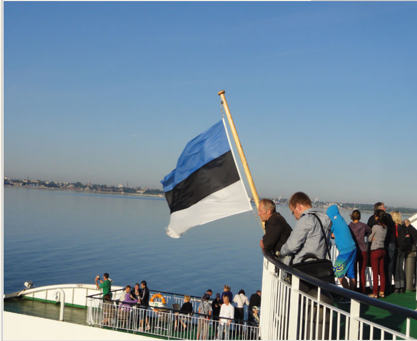
搭乘愛沙尼亞的郵輪，駛離芬蘭灣朝赫爾辛基前進