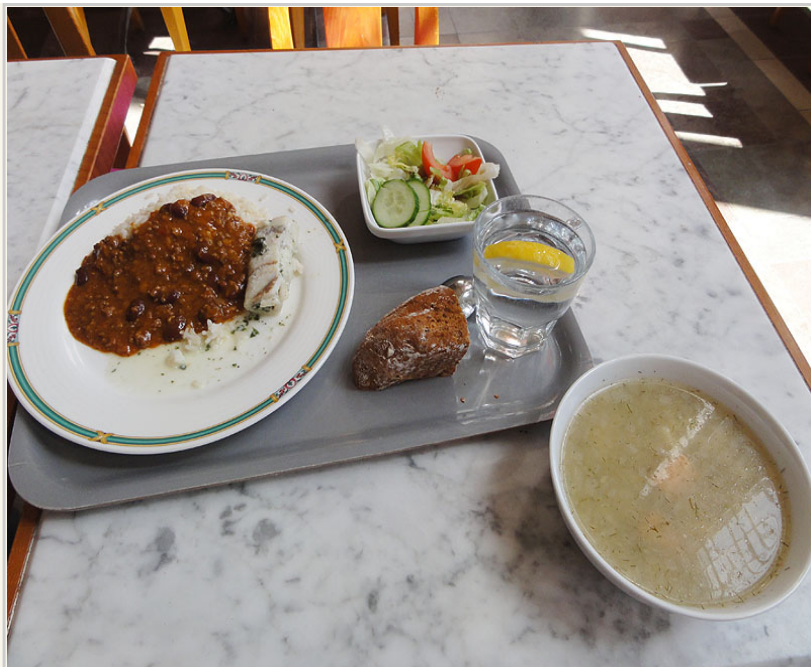
• 簡單的芬蘭食物，主要都是魚類。魚排、魚醬加上鮭魚湯配飯跟生菜。