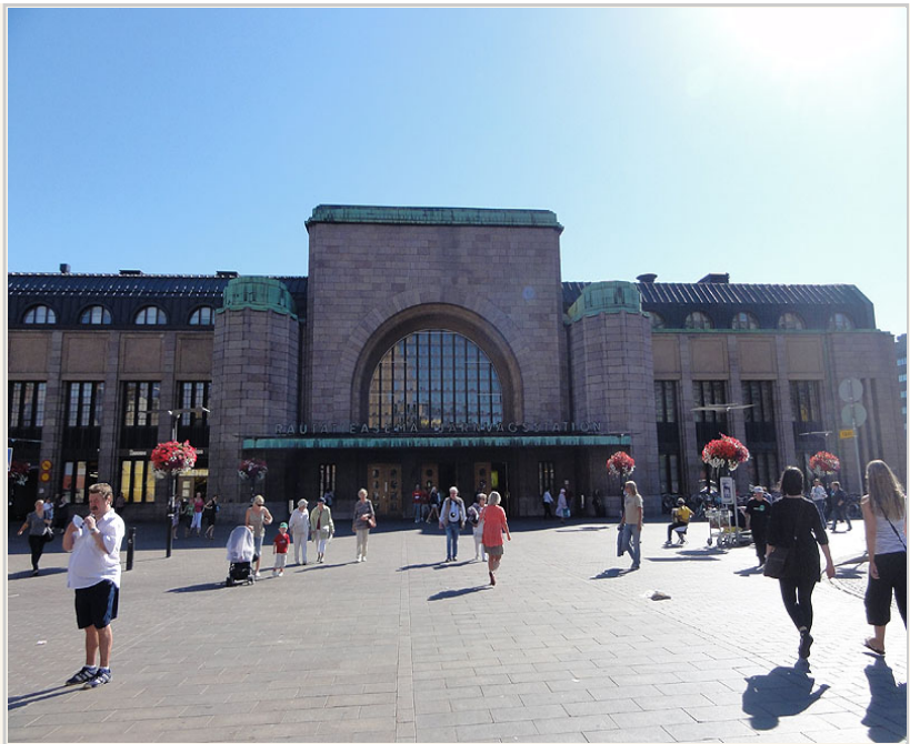
赫爾辛基中央火車站