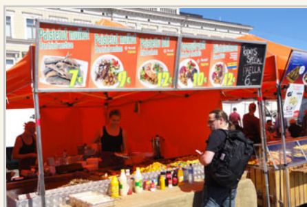
市集有不少小吃攤，賣的主要是魚類製成的食品

從赫爾辛基大教堂步行十幾分鐘，又可以看到一個醒目的紅色教堂。它是東正教的烏斯佩斯基大教堂。建築物的主體是紅色的，但是屋頂卻是金色帶「小洋蔥」外型。很多旅遊書都說，到了這附近會以為來到了莫斯科。可惜筆者八月在這是夏天，完全沒有下雪，就少了莫斯科的感覺。這個教堂會這麼俄國風也不意外，因為設計師是個俄國人。但是要在死後才開始興建，所以他並無緣見到最終完成的樣子。其實赫爾辛基有三大教堂，我只去了其中兩個，還剩一個「岩石教堂」，有興趣的就自己Google看看。