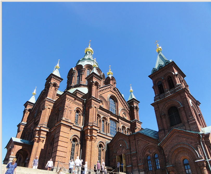
• 烏斯佩斯基大教堂很難讓你忽視它的存在