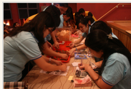
工作人員統計募款金額