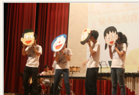
同學表演餘興節目