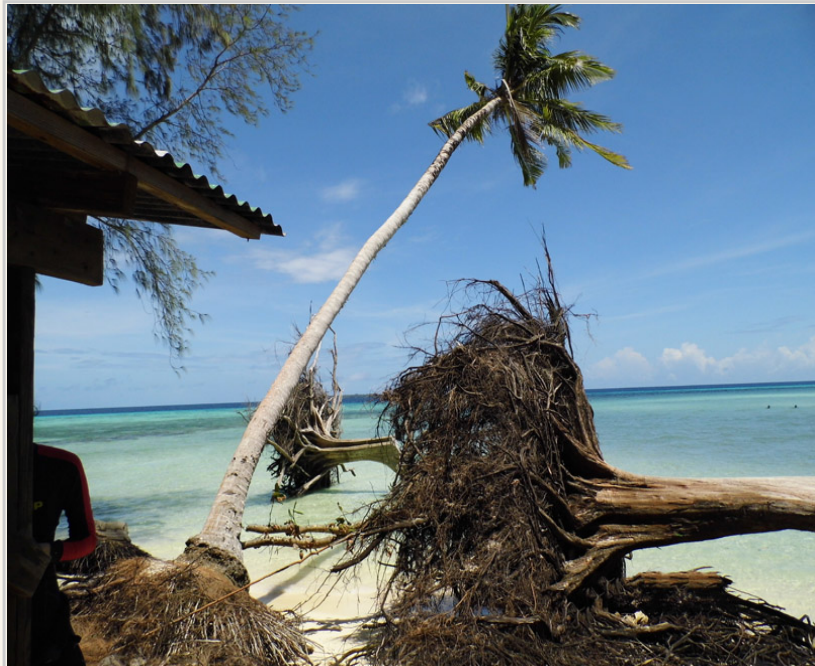
● 因為地球暖化，土地被淘空，長灘島植物一顆顆倒下