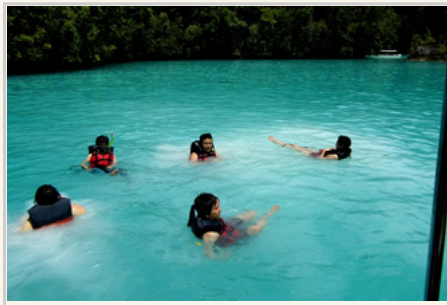
牛奶湖的海水呈現藍綠色

長灘島的美景決定於每日的「潮汐」。當海水退潮時，海面的白沙灘就會浮現出來。遊客可以從島的這端走到另外一端，綿延一公里的白色海灘非常美麗，這裡也常是媒體廣告及攝影愛好者的取景點。在長灘島沙質的土地上還可以看見粗大茂盛的樹木，令人驚訝。但是聽當地居民說，因為海平面一直上升，土地不斷的被掏空，海邊很多的樹都一棵棵的倒下。海裡生物的種類和數量都在快速的減少中，地球暖化的現象，他們可以明顯的感受到。