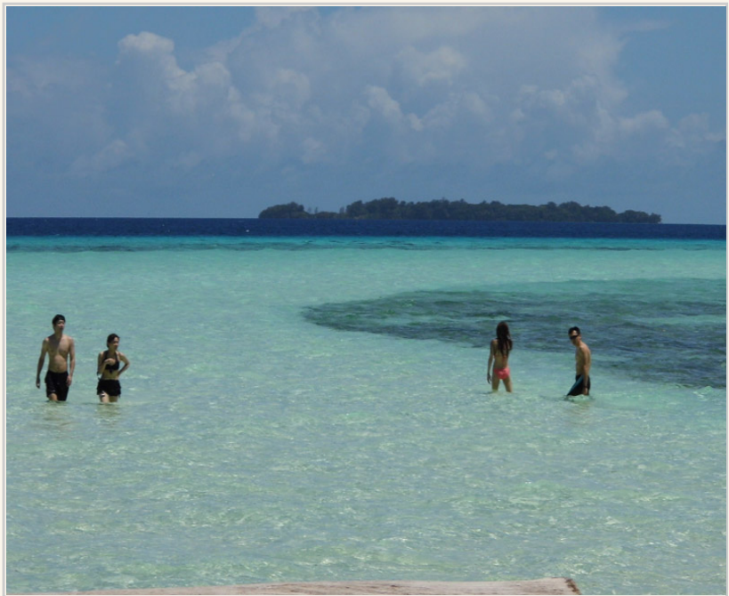
• 長灘島的美景取決於潮汐，退潮時最美！