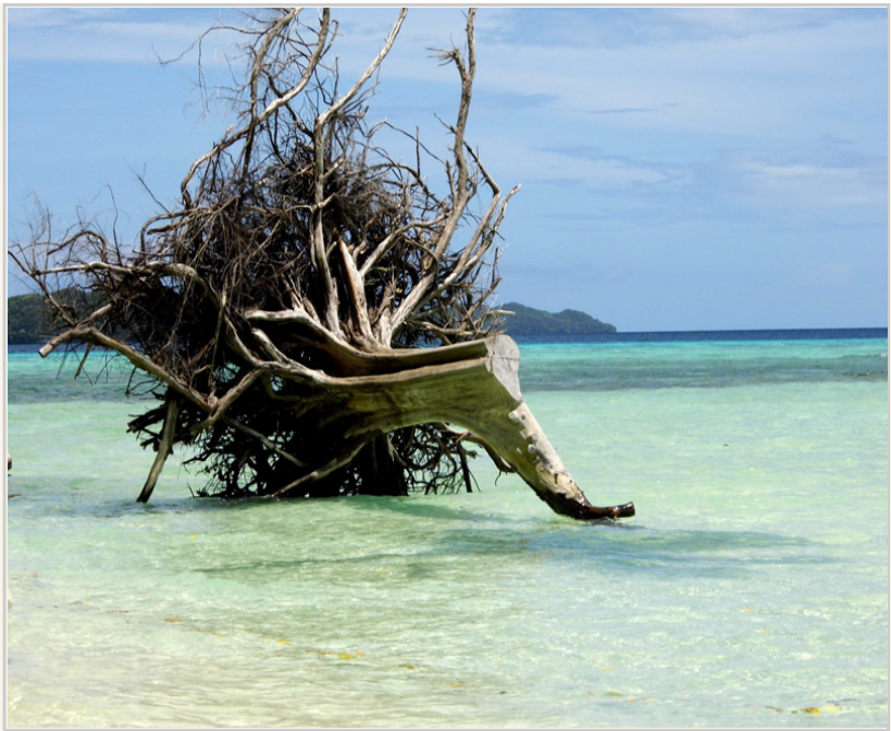
• 長灘島海灘上的浮木