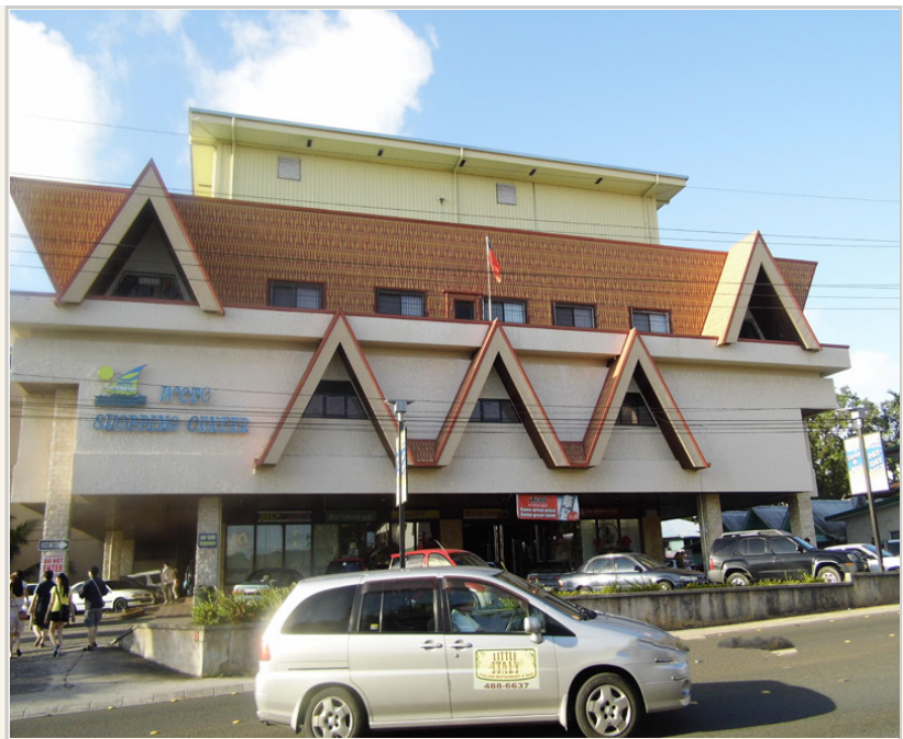
• 一樓是賣場，二樓掛著國旗則是中華民國領事館