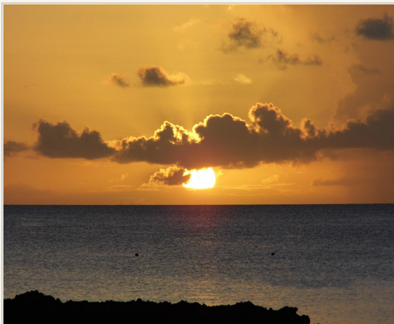
帛琉的夕陽沈靜美麗