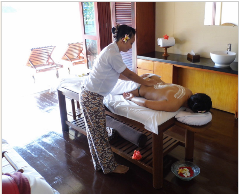
旅客沈睡在按摩之中