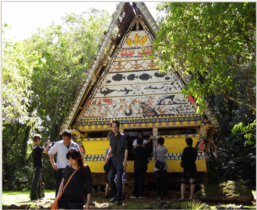
• 帛琉歷史博物館旁的男人會館