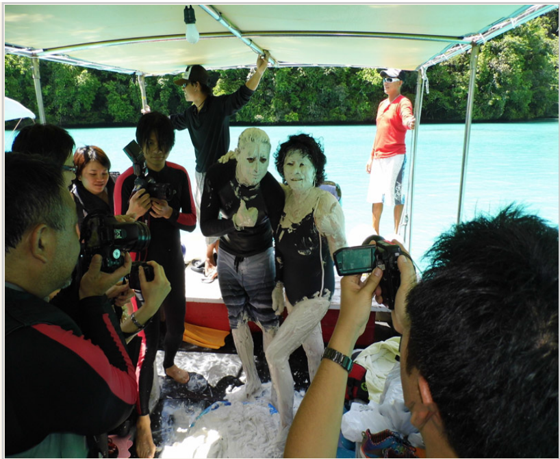
遊客將火山泥塗滿全身，大方的讓大家拍照