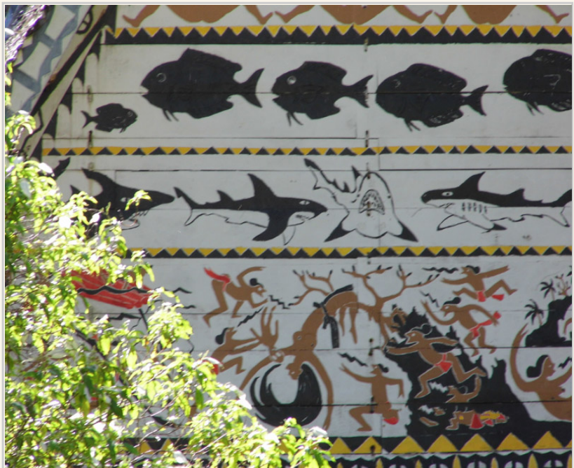
• 男人會館外表的圖案描繪著古老的傳說