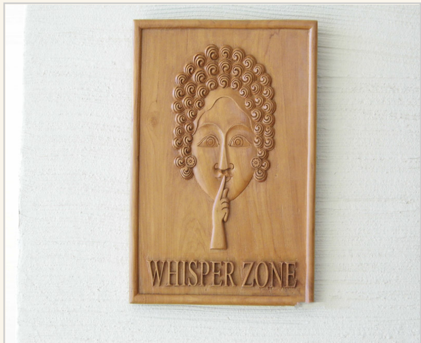
養生館「禁止喧嘩」的雕刻木牌