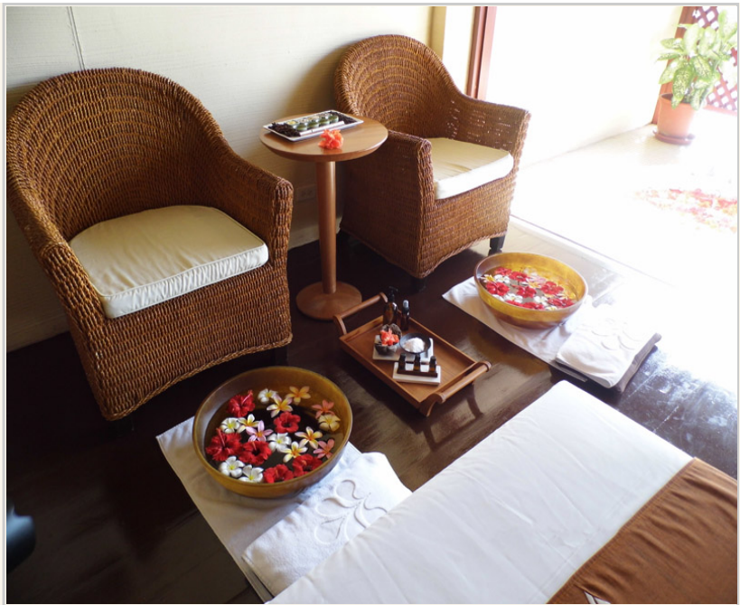
• 泡腳的水盆放滿鮮花