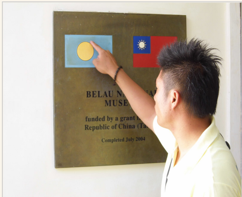
象徵中華民國與帛琉友誼的紀念牌