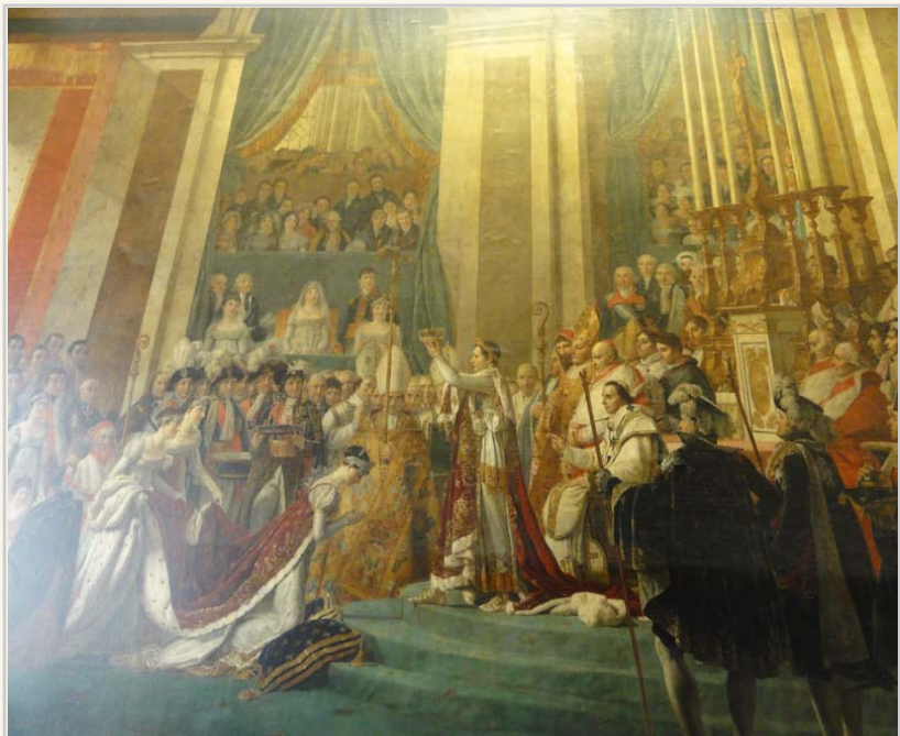
• 拿破崙加冕約瑟芬，這幅畫在羅浮宮也有一幅一樣的。與凡爾賽宮的作品普遍被認為都是出自雅各路易大衛之手。