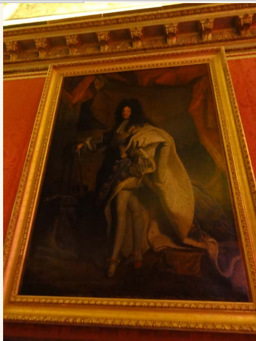
路易十四像，亞森特里戈在1702年時繪製。