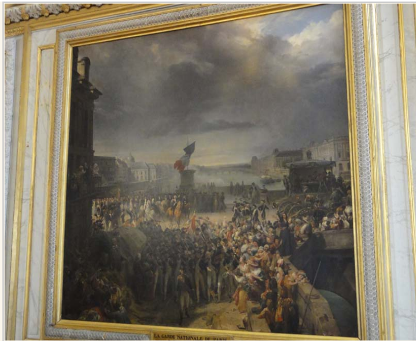
在路易十六時期爆發的法國大革命。