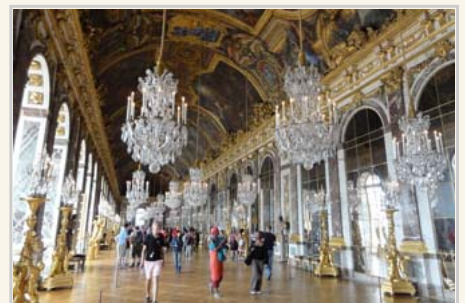
鏡廳的大型吊燈還有鏡面佈置。

「鏡廳」從名字應該可以猜到，裡面應該都是鏡子，事實上也真的是這樣。主要是一個迴廊的設計，一面朝向花園並且用大型的玻璃落地窗提供最大的視野。室內牆壁那面，用超過四百面鏡子組成。除了鏡子之外，天花板安裝大型水晶吊燈，更顯奢華。也難怪鏡廳是凡爾賽宮裡面最知名也最讓人印象深刻者。