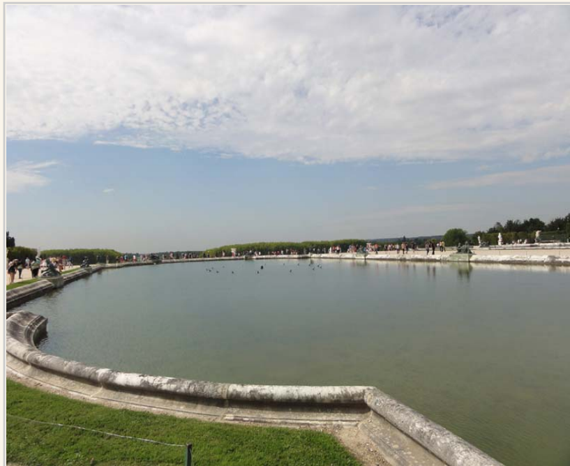
凡爾賽宮後方的人工運河。