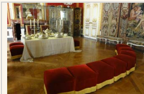
國王與王后用餐時坐在主桌，他的子孫就坐在下面。

濟困難的處境，還有稅務豁免的權力。伴隨著民權的意識高漲，法國王室終究敵不過革命的浪潮。王朝瓦解，但是留下了凡爾賽宮讓後人憑弔。（終）