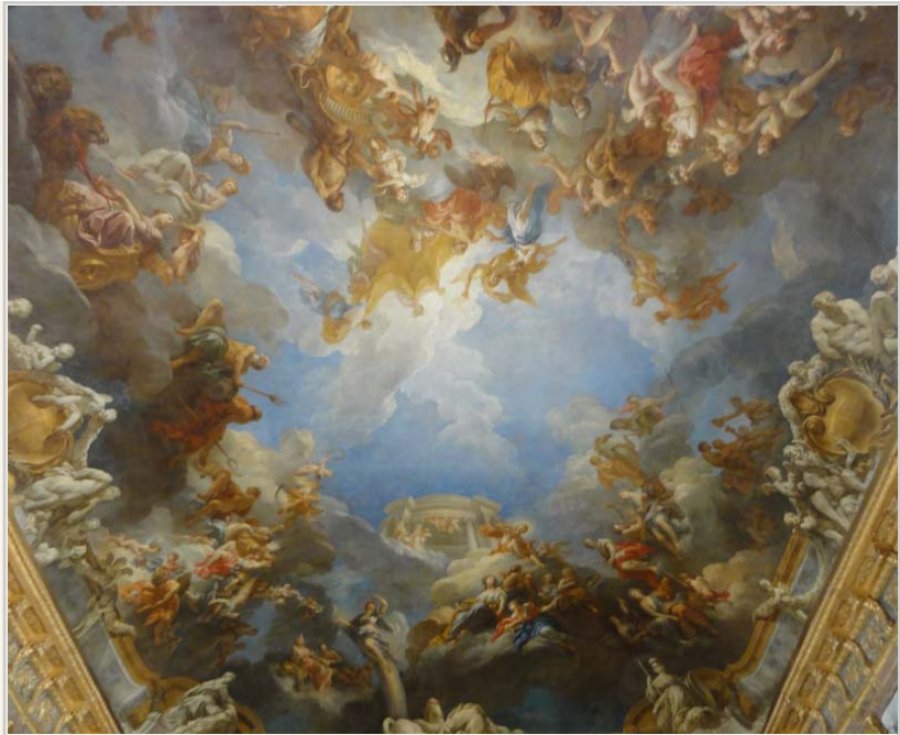
• 海格力士廳原本是小教堂，現在因為穹頂的「海格力士與眾神」壁畫而得名。