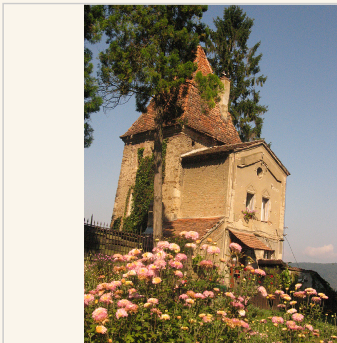
山坡上不知名的小教堂