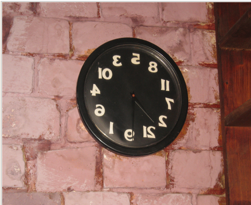
廳牆上特殊的時鐘