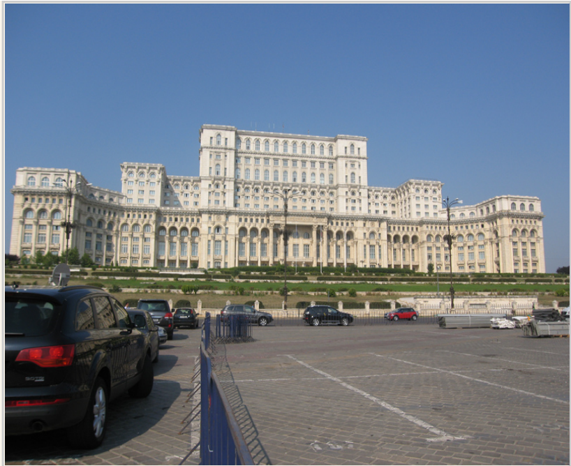
世界第二大的政府大廈