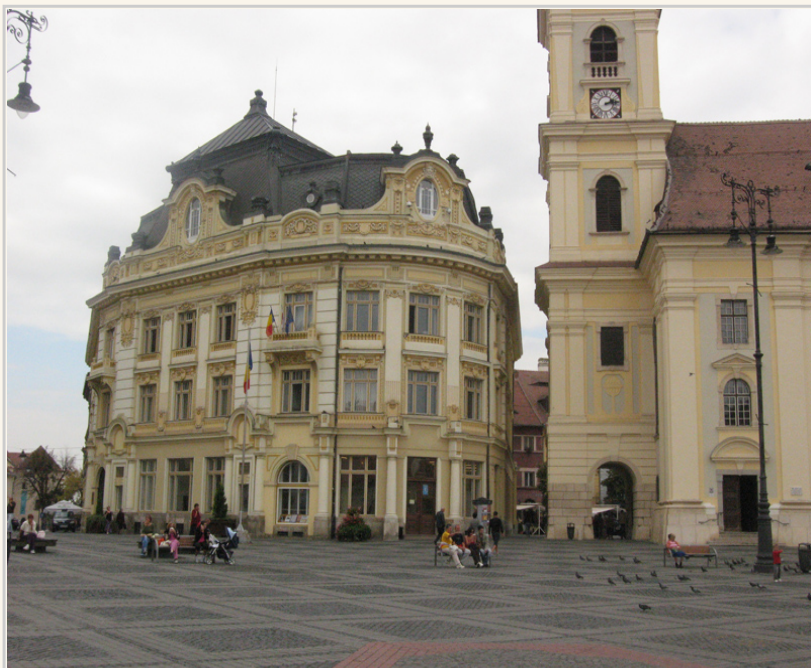
西畢烏古城廣場一隅