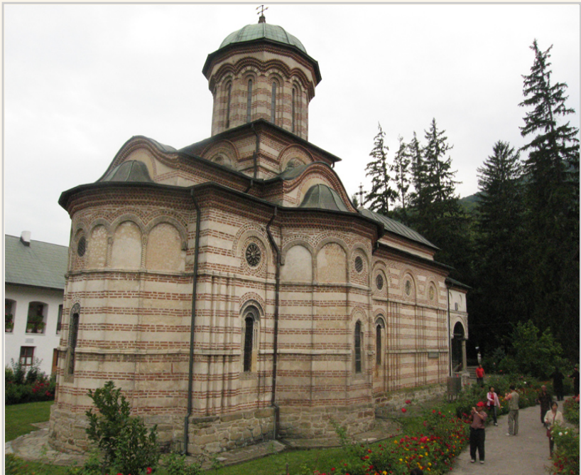
• 弗拉德三世祖父葬身的修道院