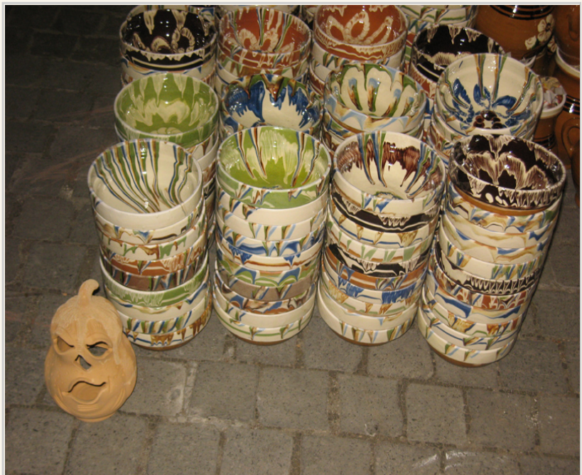
• 西畢烏古城廣場的商品