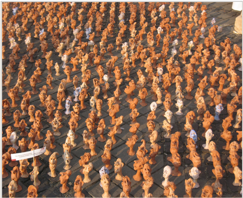
• 地上放滿各種表情的陶瓷品