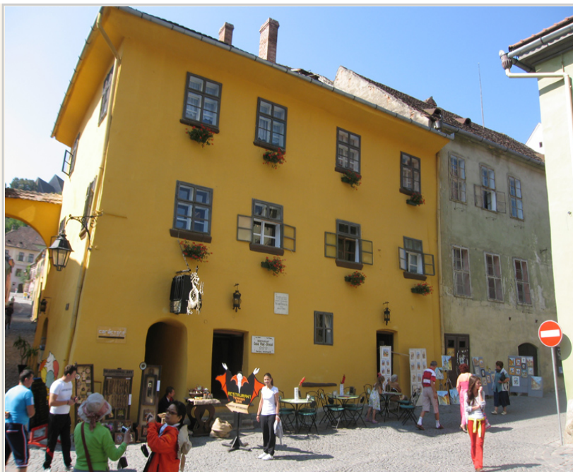
黃色老屋是吸血鬼德古拉弗拉德三世的出生地