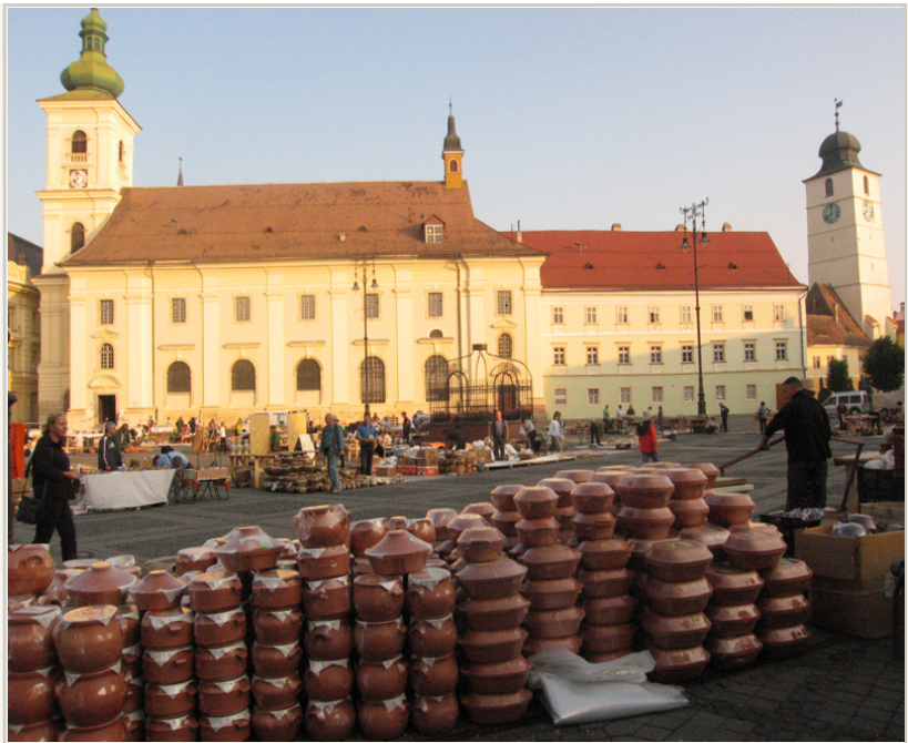
• 西畢烏廣場上的攤販