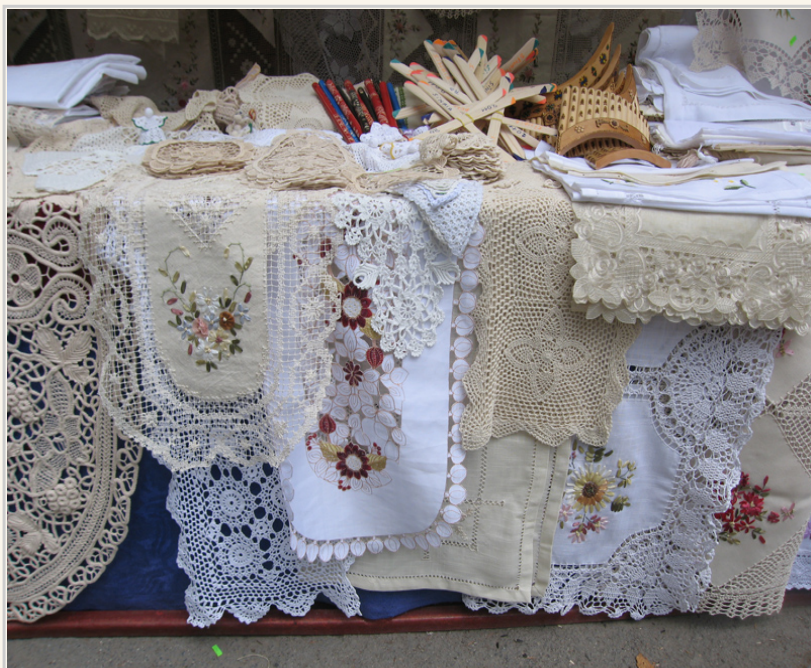
編織品是羅馬尼亞特產