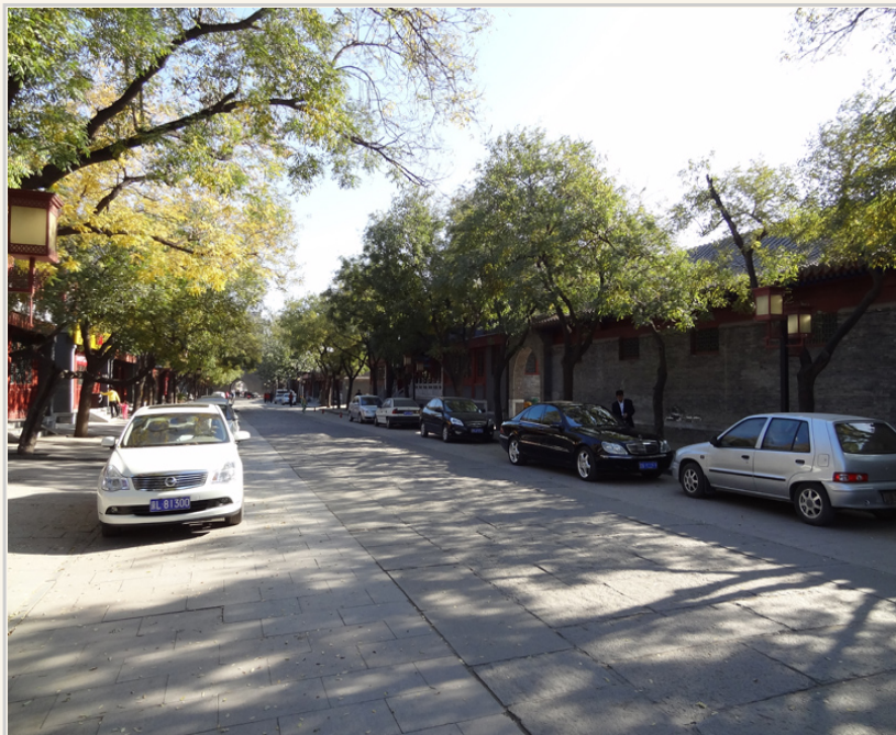
• 宛平城內的「步行文化街」。