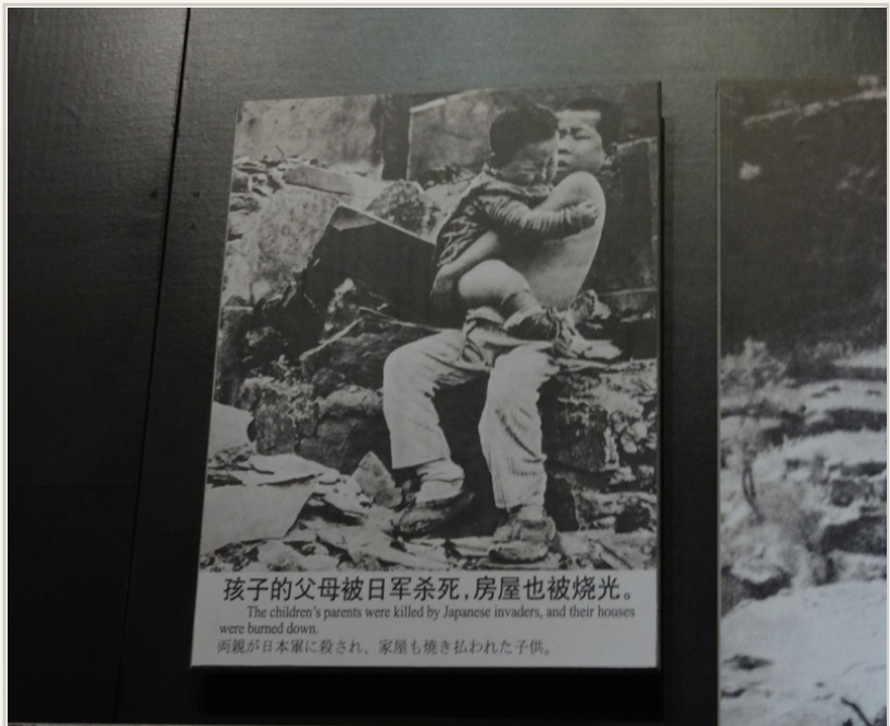
• 日軍侵略的殘忍畫面，我們都在歷史課本上看過。