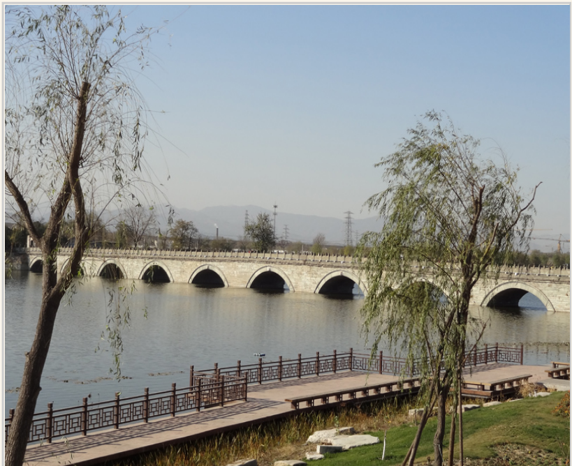
遠拍盧溝橋的圓弧外觀。