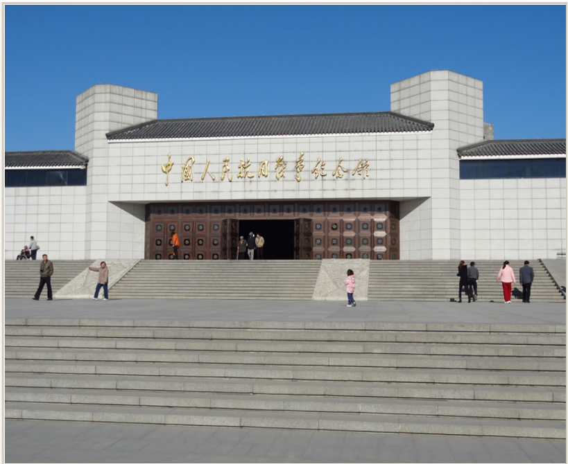
• 中國人民抗日紀念館的入口。