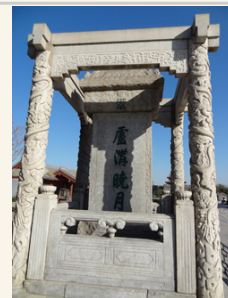
乾隆皇帝題字的「盧溝曉月」

中國人民抗日戰爭紀念館內的歷史呈現，我覺得有很多地方是有爭議的。或者說是台灣的歷史課本灌輸給我們的觀念，中國國民黨的軍隊在抗日時是扮演主要的角色。抗日期間，中國共產黨藉機壯大，當時雖然是國共聯合抗日，但實際上中國共產黨遵守毛澤東的方針：「一分抗日、兩分應付、七分發展」。正面戰場、抗日主力應該是國民黨領導的國軍，這是眾所皆知的事情。但是在抗日戰爭紀念館中，很明顯的把抗日的功勞都歸中國共產黨。一些重要戰役的主要將領，也都變成紅軍幹部。一連串的「愛國教育」後，自然也不用太意外中國政府怎麼解讀台灣幾起民間抗日事件。我想還是把參觀重點放在文物吧！例如雙方兵器與當時民間生活的器物。中國人民抗日戰爭紀念館算是相對晚期成立的博物館，所以裡面的擺設布置還算是非常的新穎。這裡入場也是免費的，三個展區加上不定期的特展，應該可以消磨好幾個小時。