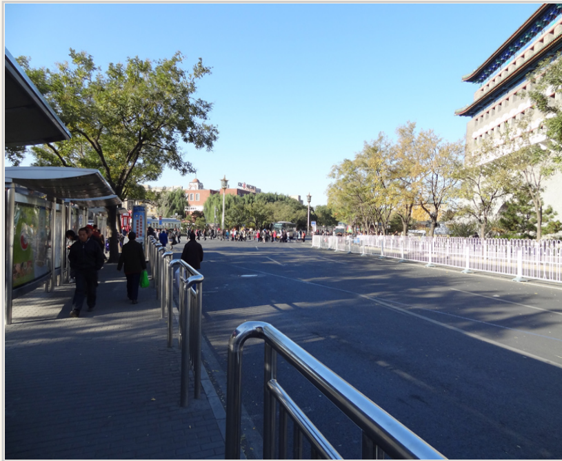
• 從北京前門大街的公車站搭車到宛平城。