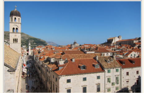
杜布羅尼克 (Dubrovnik) 舊城

杜布羅尼克 (Dubrovnik) 舊城區濱海臨山，四周有寬厚高大的城牆碉樓，城內有歌德式、巴洛克到文藝復興時期各種建築，1979年被列入世界文化遺產，Dubrovnik 城牆是 360 度從每一個角度欣賞 Dubrovnik 的最佳方法。最美的畫面在北面的一段，可看見 Dubrovnik 舊城區內的紅頂屋展現在蔚藍色的亞德里亞海背景上。