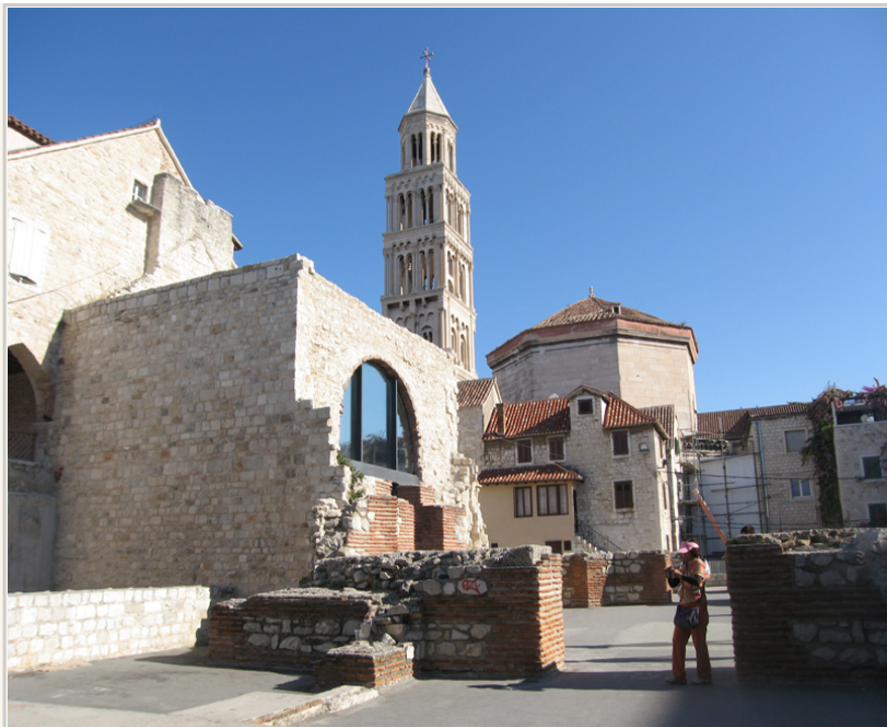
• 克羅埃西亞海邊古城～特羅吉爾