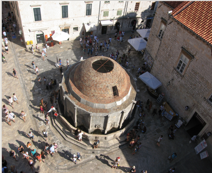
杜布羅尼克舊城區大歐諾弗里耶水池