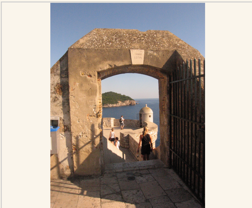
杜布羅尼克舊城區城牆