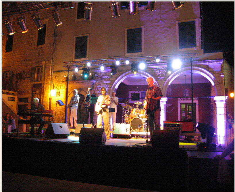
• 聖雅各大教堂外廣場・晚間有民間團體的演唱