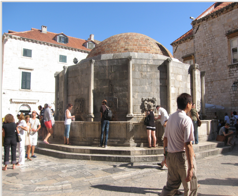
杜布羅尼克舊城區大歐諾弗里耶水池