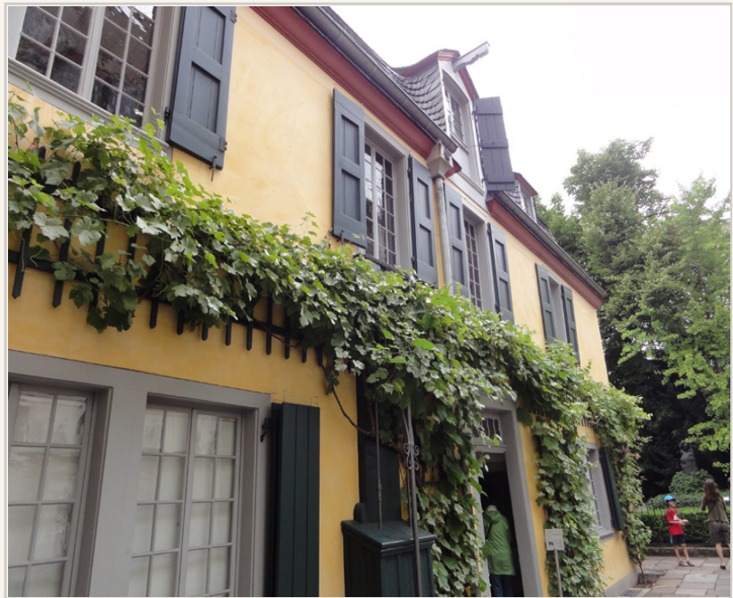
• 從這角度拍貝多芬的家，就很接近小時候看貝多芬傳時他家的樣子。