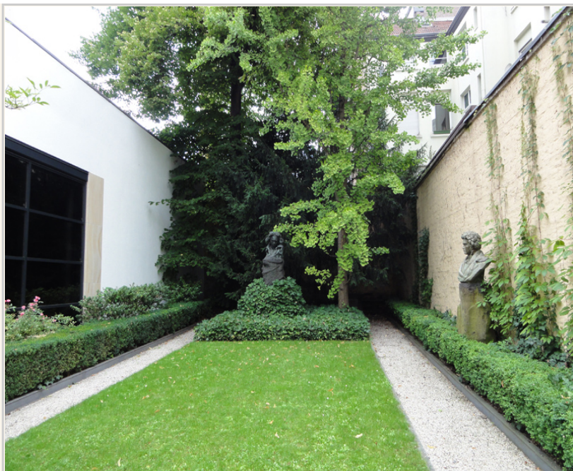
貝多芬故居中庭的一小片綠地。