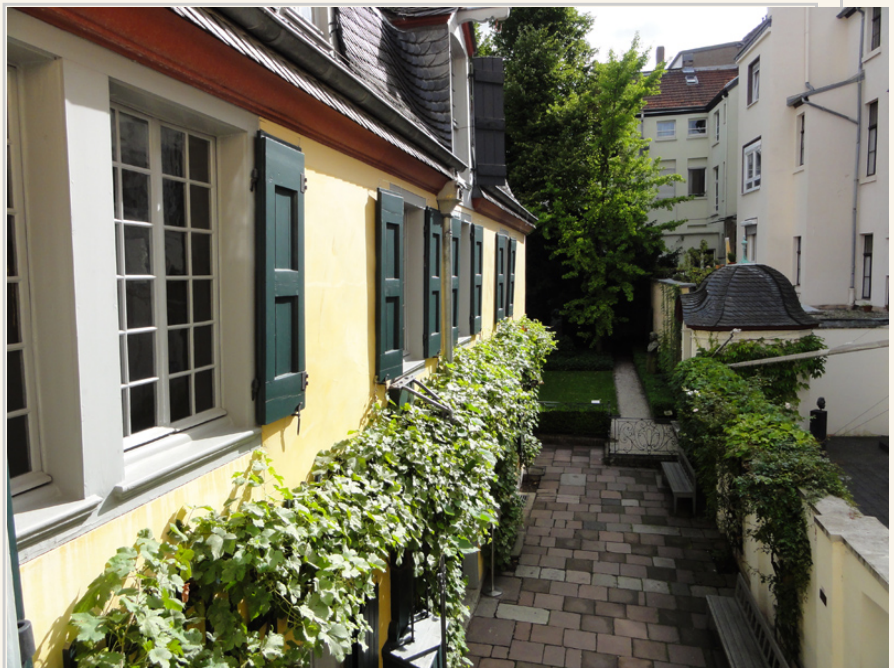
站在貝多芬故居的二樓往外拍中庭。