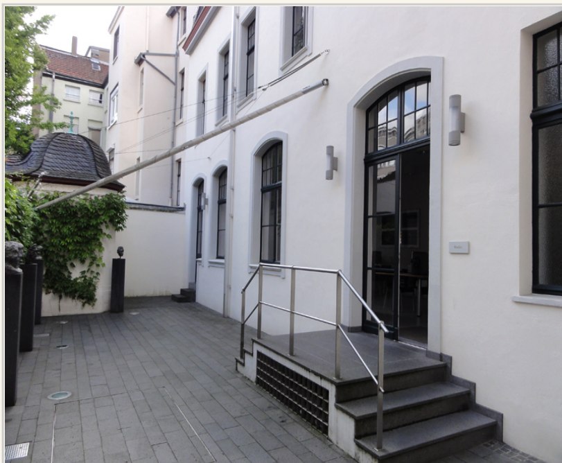
貝多芬研究室，裡面主要是資料檢索還有文獻。