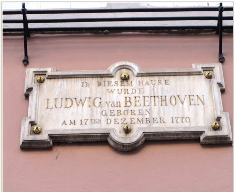
• 1770年・貝多芬生於此地。