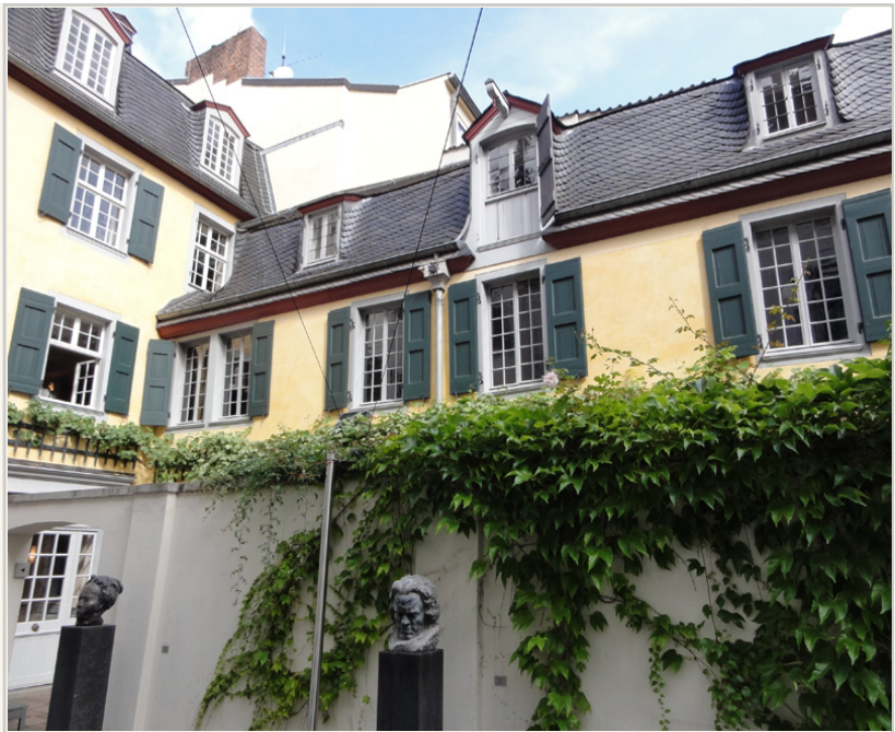
室內空間裡面是不能拍照的，戶外主要是貝多芬的雕像。