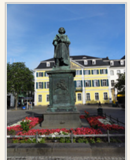
城鎮中心的貝多芬雕像。

展場裡面多數是不能拍照的，展出內容不外乎就是一些貝多芬的雕像，尤其是戶外的空間。其實站在門外看這間房子時，有些失望：「怎麼這麼小間」，加上還要收不是很便宜的門票，總是希望展出的空間大一點、內容多一點。但是到了庭院一看，才符合我心目中的期待。