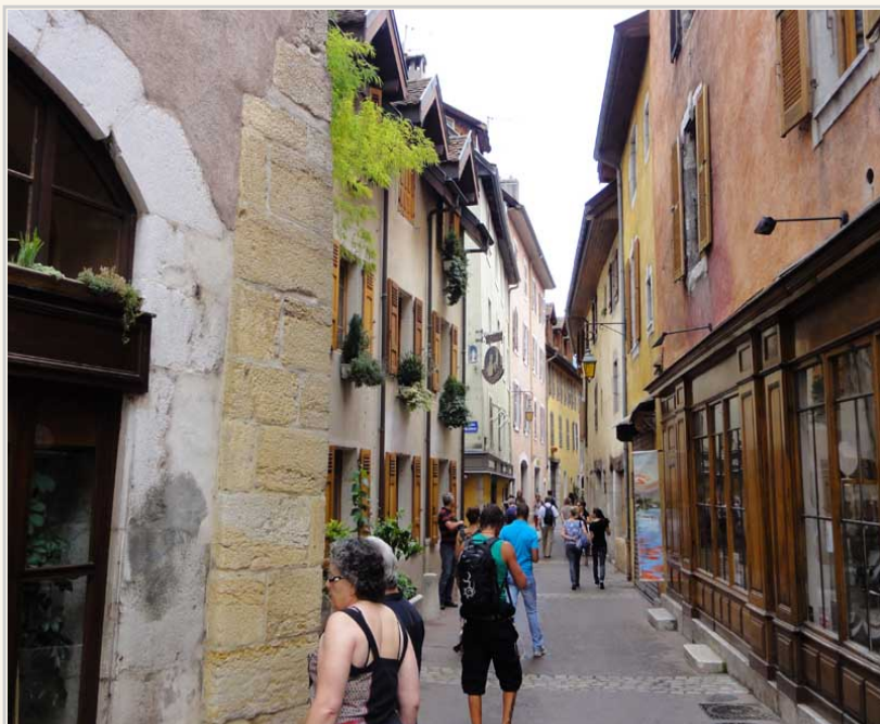
• 漫步在安錫古城裡面的羊腸小徑。