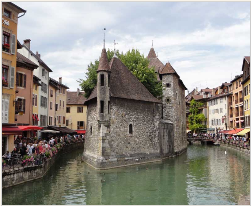
• 安錫的地標：島中王宮，曾經是總督府邸、行政聽、法庭、監獄。