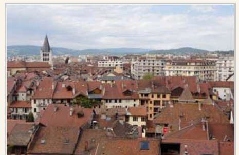
站在相對高處拍攝安錫古城。

從里昂到安錫只有「區間車」可以搭，從里昂車站出發大概兩小時可以到，往來列車班次頻繁。整個安錫的活動空間真的不大，所以只要半日遊就夠了。如果要遠離里昂熱鬧的喧囂，安錫確實是個不錯的選擇。我覺得旅行可以很忙碌，也可以很悠閒，完全看旅行目的地型態。如同你來到東京或是香港，不自覺的跟上當地人的腳步而忙碌起來。反觀來到安錫，在一片湖光山色之下，就真的有悠閒的感受。尤其是夏天，法國南部的氣候涼爽，非常適合避暑。到了冬天下起瑞雪，阿爾卑斯山又是不一樣的滑雪度假氣息。