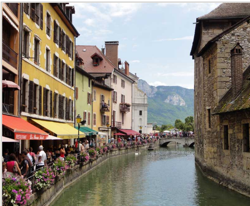
• 運河旁邊的咖啡廳、餐廳林立。