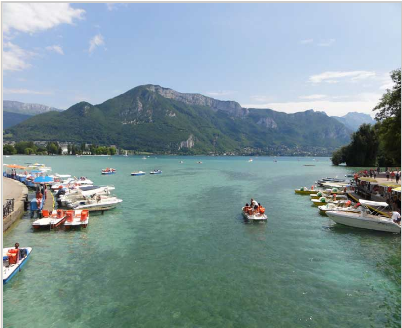
• 安錫湖與阿爾卑斯山。