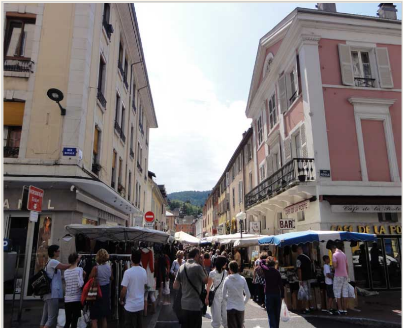
• 安錫車站附近的市集。