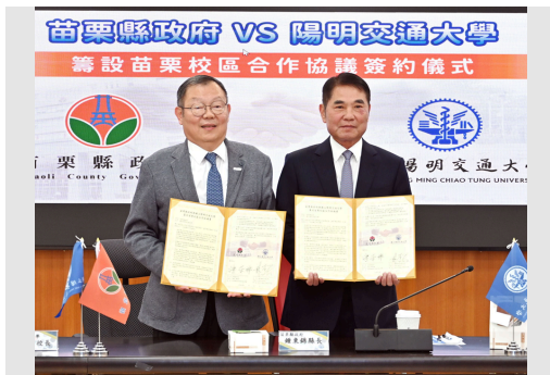
本校與苗栗縣府簽署合作協議