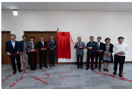
陽明交大攜美IC大廠Altera成立聯合實驗室