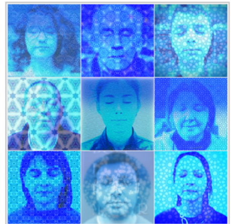
黃盟欽的作品「此刻 你看到的我是藍色的」