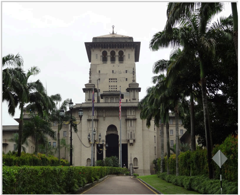
蘇丹依布拉欣大樓是新山的行政中心，過去曾被日軍佔領