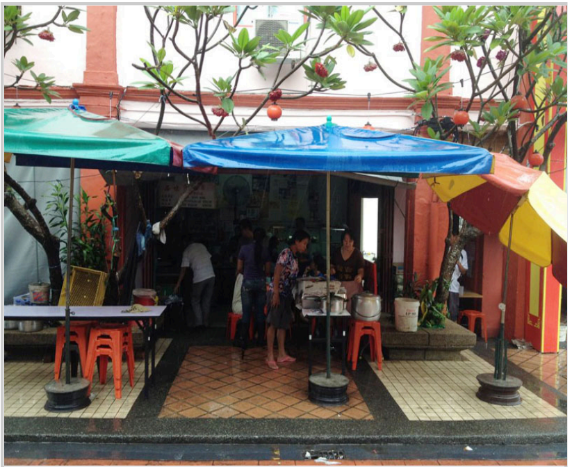
位於陳旭年街，到了新山一定要去的「錦華餐室」