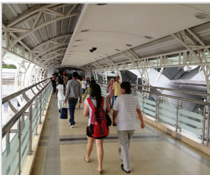
出了入境關卡，穿過天橋直達城市廣場