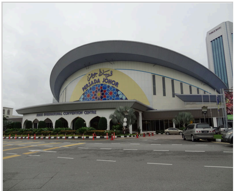
新山國際會議中心