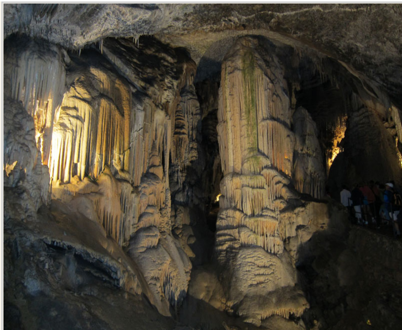
波斯多瓦那鐘乳石洞內