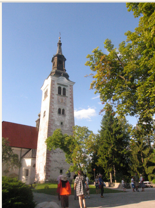
• 小島上千年古教堂～聖母升天教堂