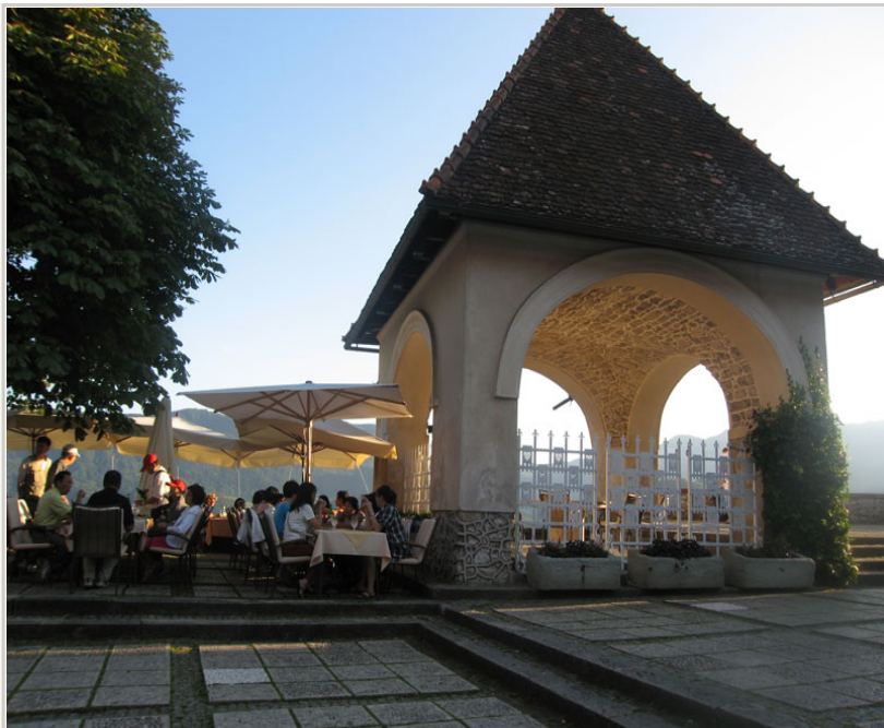
• 旅客在小島上用晚餐