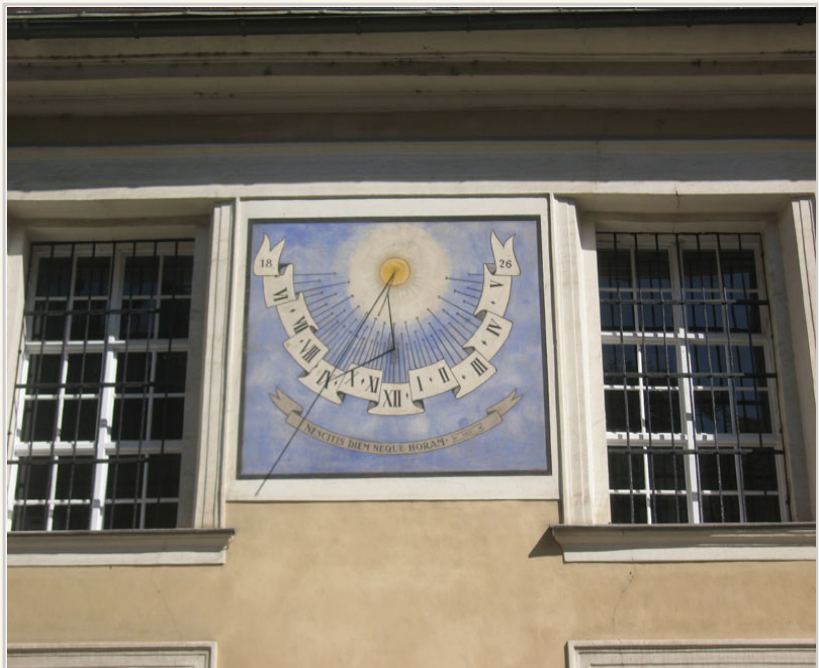
• 藉太陽陰影決定時間的時鐘