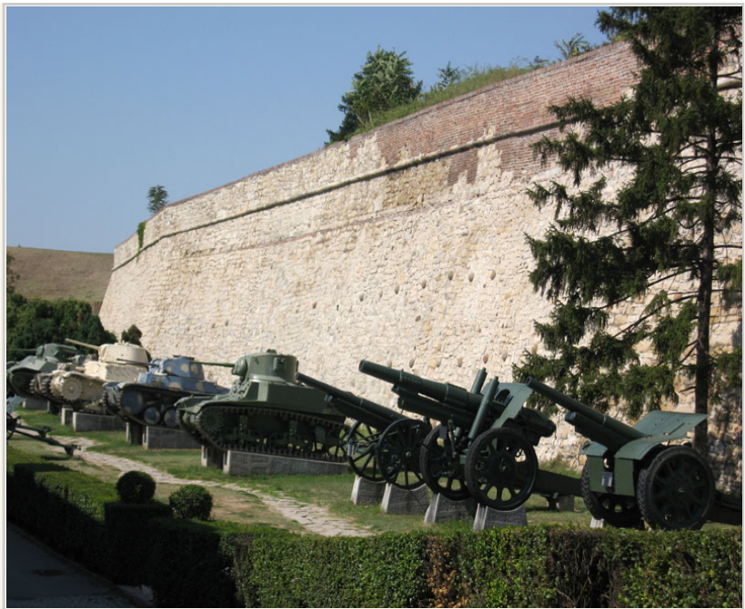
卡列門登堡外陳列著壯觀的戰車