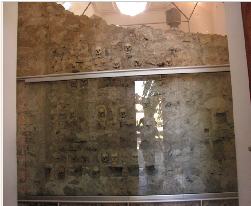
骷髏塔土坑裡鑲嵌著人的頭骨