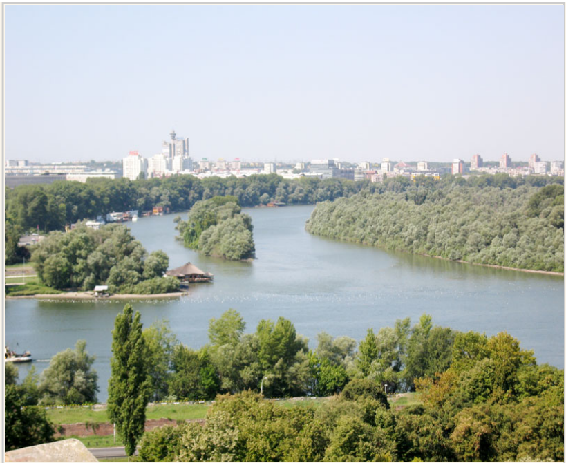
• 多瑙河與薩瓦河的交會處