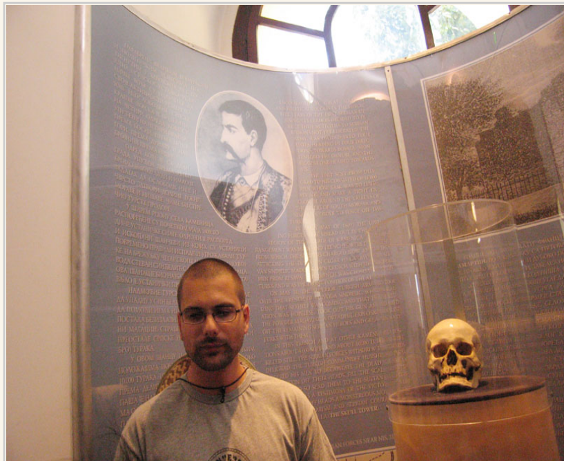
骷髏塔象徵塞爾維亞人不肯屈服的精神