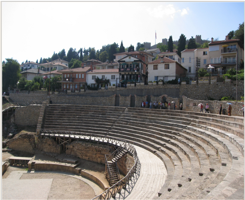
• 帕華洛帝曾在此露天劇場表演2