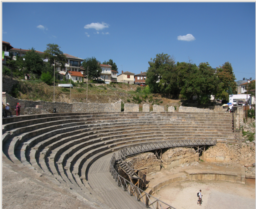
帕華洛帝曾在此露天劇場表演1