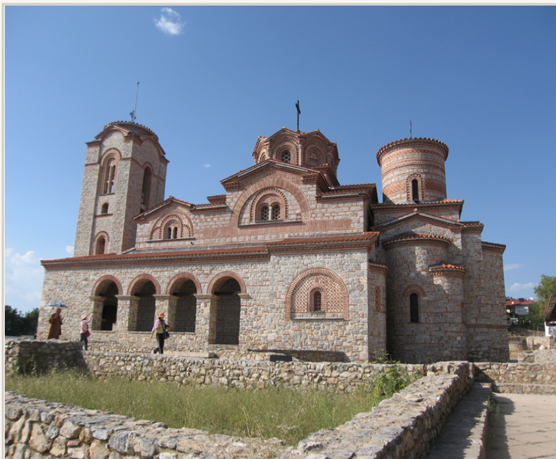
馬其頓首都史高比耶的東正教教堂