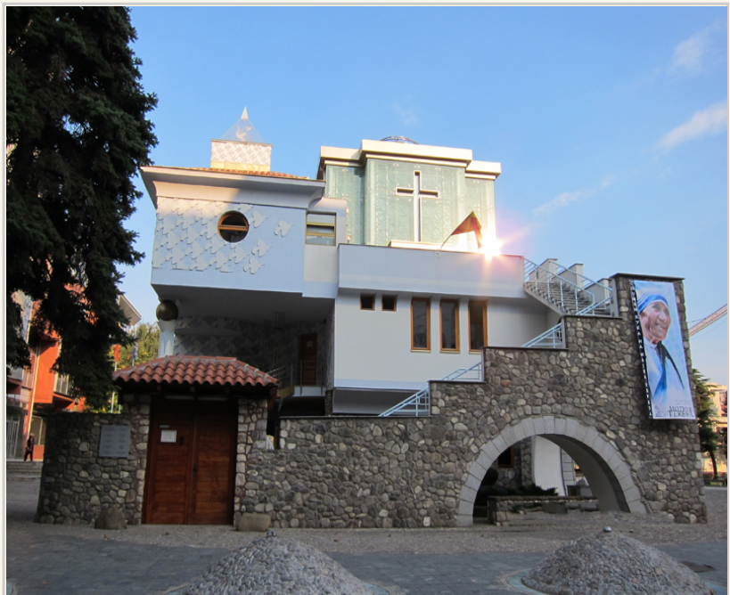
• 德雷莎修女紀念教堂外形