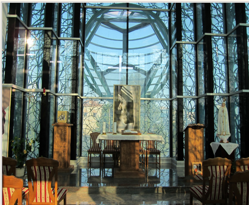
• 德雷莎修女紀念教堂內部2