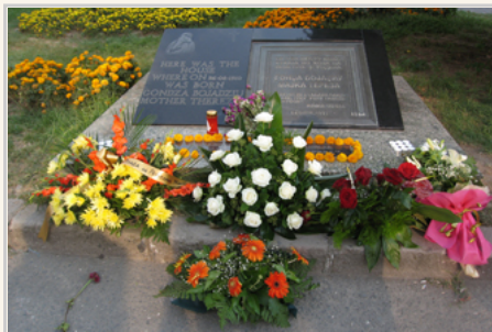
街頭德雷莎修女紀念碑

馬其頓是位於巴爾幹半島南部的內陸國家，東臨保加利亞，北臨塞爾維亞，西臨阿爾巴尼亞，南臨希臘。原為南斯拉夫的一部分，1991年南斯拉夫社會主義聯邦共和國解體後獲得獨立。首都與最大都市是史高比耶。