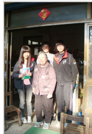
隊員與家訪對象合影留念。