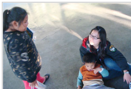
育樂營時隊員與小朋友互動。

因此，本次出隊，正是我們前3次出隊成果之驗收，以及未來繼續進行合作之開端。經過三年固定的造訪，部落中的居民對時常前來的「陽明大學的學生」多有良好的印象，互動也從以往的點頭微笑到現在的主動問好；更有熱情的居民，積極地參與醫服隊所舉辦的各項計畫，並在出隊期間時常前來向同學詢問健康相關的資訊，這些都是以往未曾有過的改變。此外，本次出隊根據前3年出隊之經驗，與部落中教會、發展協會以及村辦公室合作，進行各項新的活動，如：送年菜關懷獨居老人；與居民共同清掃環境；創作馬賽克拼貼藝術品以美化部落；舉辦親職及健康講座；學期間於部落舉辦減重比賽並於出隊期間發表成果等，在傳統的家訪、育樂營及民眾康樂活動之外，更加貼近當地居民的需求，參與程度亦較往年熱絡。