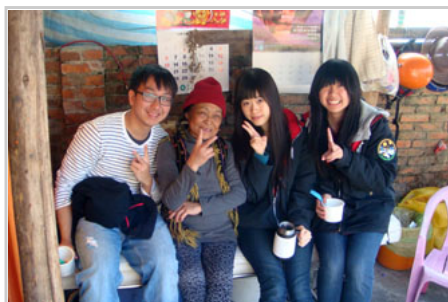
隊員進行「年菜送到家」獨居老人關懷活動。