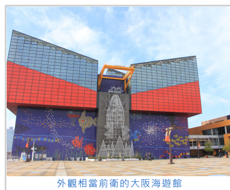
外觀相當前衛的大阪海遊館

位於大阪市港區的『海遊館』在1990年7月20日開幕（比我年輕4個月），總蓄水量達11000噸，是世界最大規模的城市型室內水族館。根據蓋亞假說（Gaia Hypothesis），海遊館以環太平洋火山帶及環太平洋生命帶為主題，用14個大型水槽，呈現了世界10個地域的自然生態環境。世界上最大的魚類—鯨鯊悠遊於蓄水量達5400噸的「太平洋」水槽。鯨鯊從地面到海底環繞太平洋兩周的路程，忠實地被呈現在遊客眼前。海遊館展示了約580種共30000餘隻形形色色的生物，不僅僅是魚類，還有各式的兩棲類、爬蟲類、鳥類、哺乳類以及無脊椎動物、植物等。