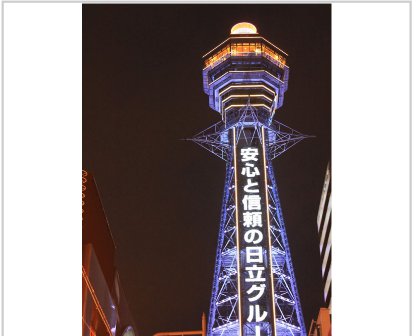
夜裡的通天閣，裡頭住著日本的福神 Billiken