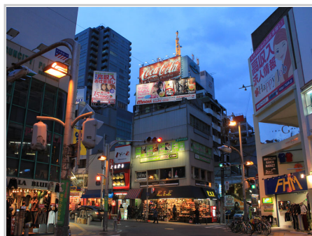
夜裡的美國村充滿異國風情

『心齋橋』是位於大阪市中央區的商業購物區，狹義上是指大阪中心部向南北延伸到御堂筋東側的心齋橋筋。但一般而言會包含到以大阪市營地下鐵心齋橋站為中心的御堂筋西側。商圈附近的『美國村』是高級名牌專門店、時裝店及咖啡店的集中地，遠近馳名。