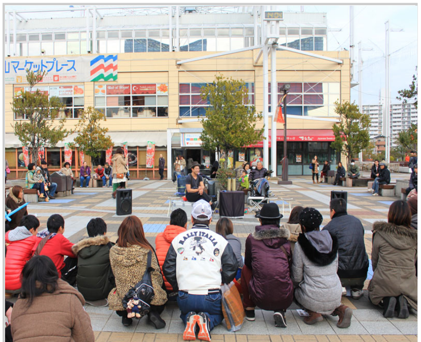
• 海遊館外街頭藝人的表演，吸引著圍觀群眾