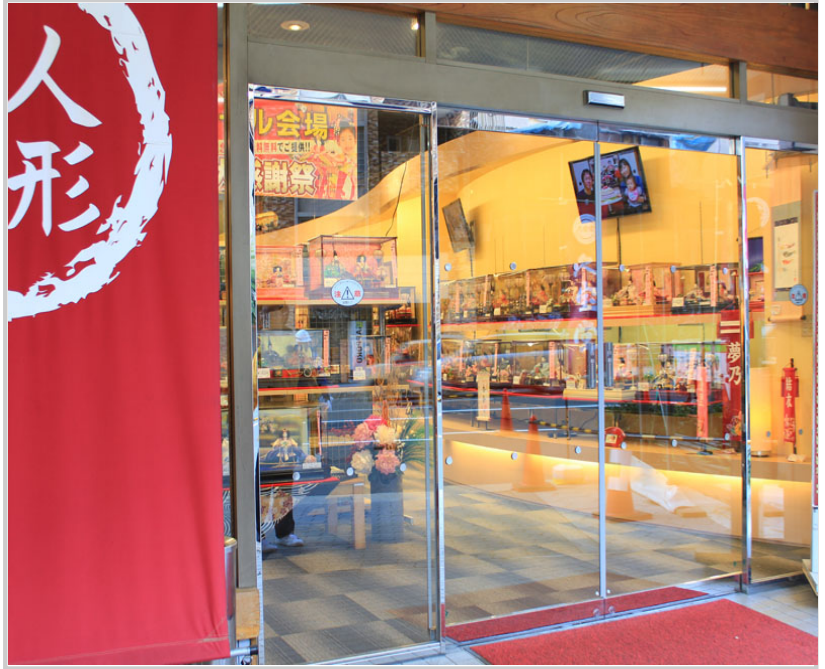
日式傳統人形紙，一套要價上萬元，可不便宜啊！