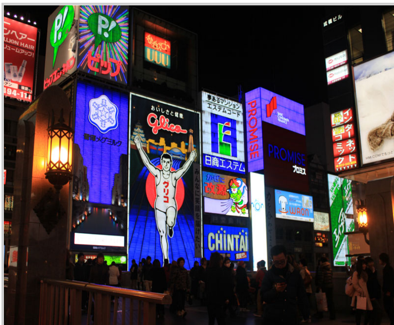
鼎鼎大名的固力果霓虹板