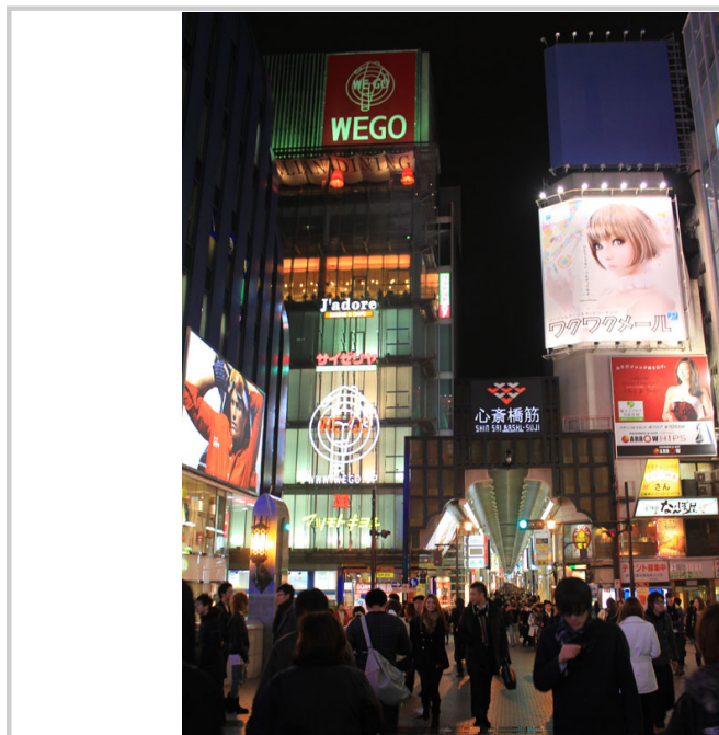
心齋橋商店區人來人往，相當熱鬧