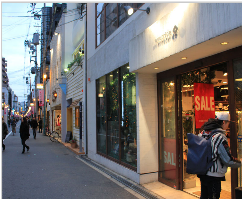
新興逛街聖地～堀江