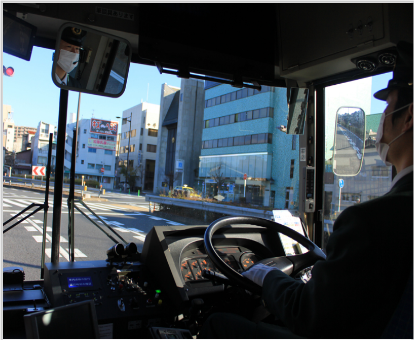
京都最主要的交通工具～市巴士