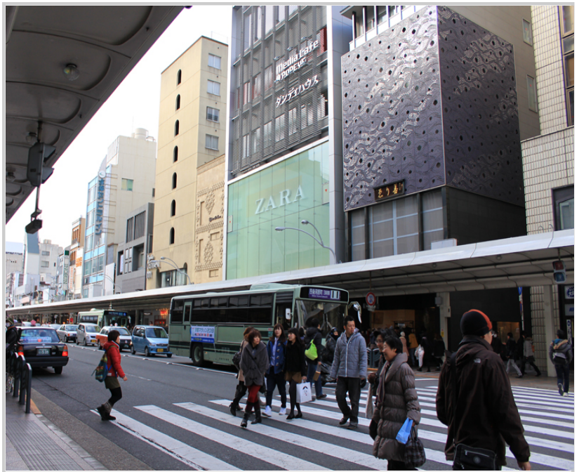
兼容傳統與現代的河原町大街