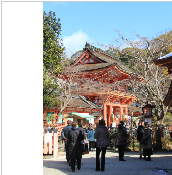
上賀茂神社鮮紅的內殿