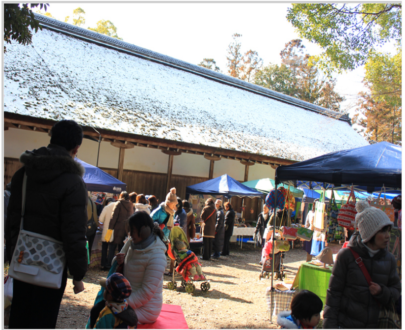
上賀茂神社旁的手作市集