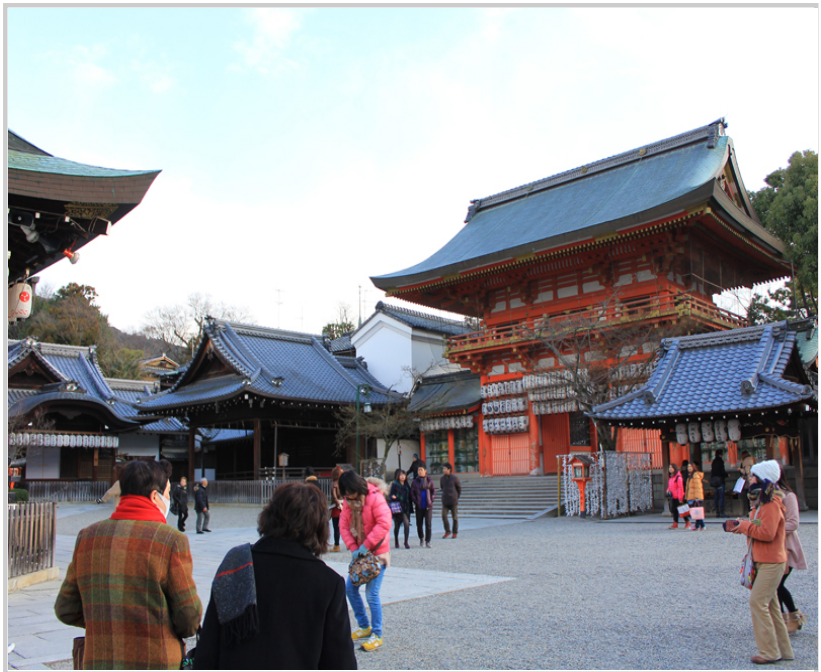
八坂神社裏頭人來人往熱鬧不已