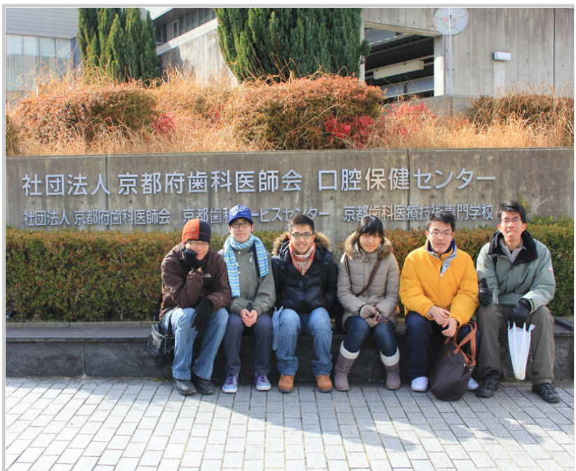
路上遇見齒科醫師會當然要來合影一張