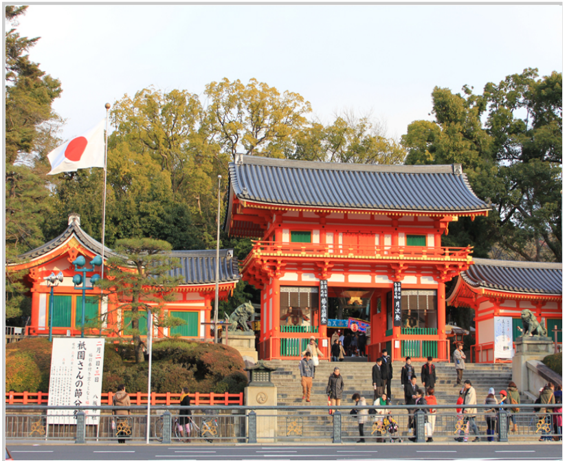
壯闊恢弘的八坂神社