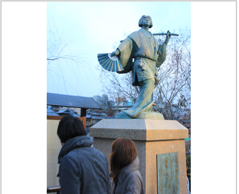
出雲阿國雕像，是著名的歌舞伎表演者，被認為是歌舞伎的創始者