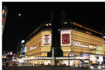
夜晚河原町上MARUI百貨OIOI

祇園作為八坂神社的門前街道是日本規格最高的繁華街，道路兩旁縱橫方向能通風用的格子窗，大街上格調與舞妓的風采特別相襯，街上排列著銷售日式和服事務的京都特有商店，既繼承了傳統，同時也接受著新時代改變，融合出一番特別的京都情緻。