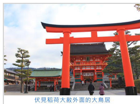
伏見稻荷大赦外面的大鳥居

第一次來到京都，當然不免去以「千本鳥居」聞名世界的伏見稻荷神社，位於稻荷山的山麓上，整座山都被視為聖地範圍，神社內主要是祀奉以宇迦之御魂大神為首的諸位稻荷神，自古以來就是農業與商業的神明。除此之外也配祀包括佐田彥大神、大宮能賣大神、田中大神與四大神等其他的神明，由於每年都有大量的香客前來祈求農作豐收、生意興隆，使得該神社成為京都地區香火最盛的神社之一。