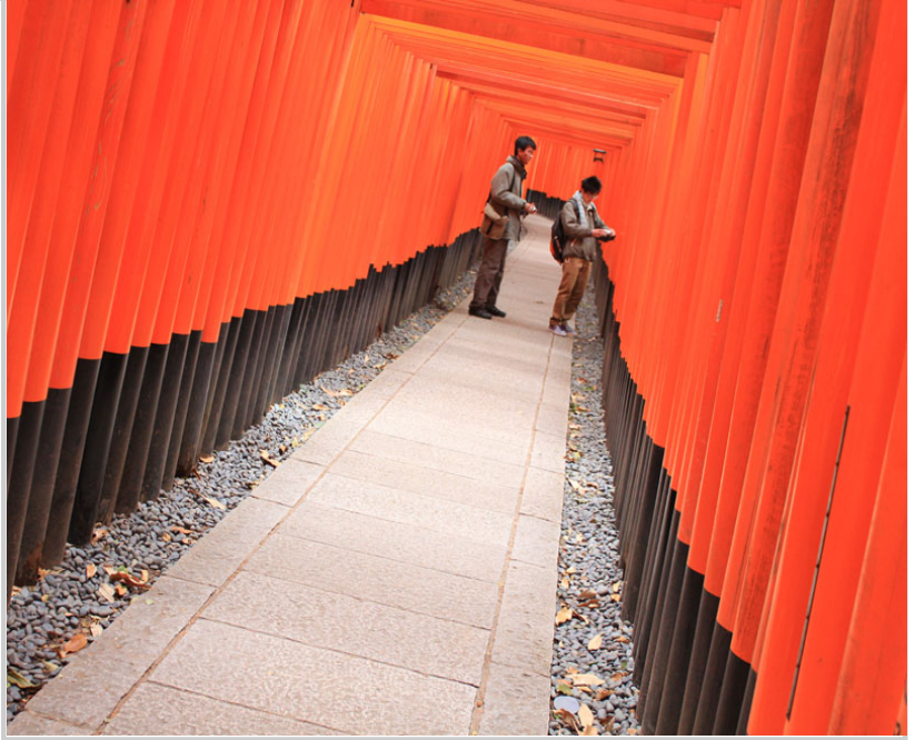
層層疊疊的千本鳥居・看不到盡頭啊!