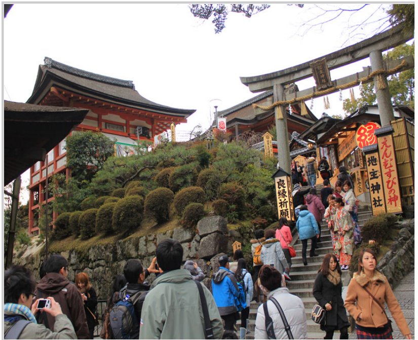
求姻緣據說相當靈驗的地主神社