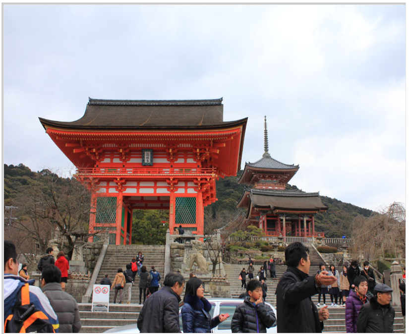
清水寺外眾多的遊客和香客