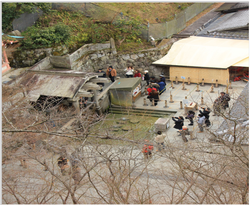
• 音羽の滝・從音羽山嘩瀾瀾流出的三道清泉自古以來被稱為「黃金水」、「延命水」