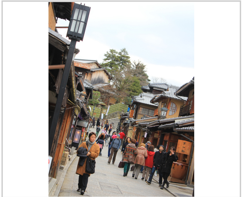
• 往清水寺路上的二年坂和三年坂