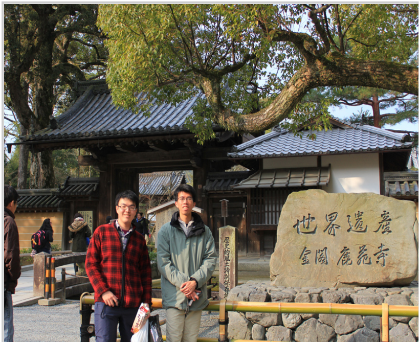
世界文化遺產之一的金閣寺