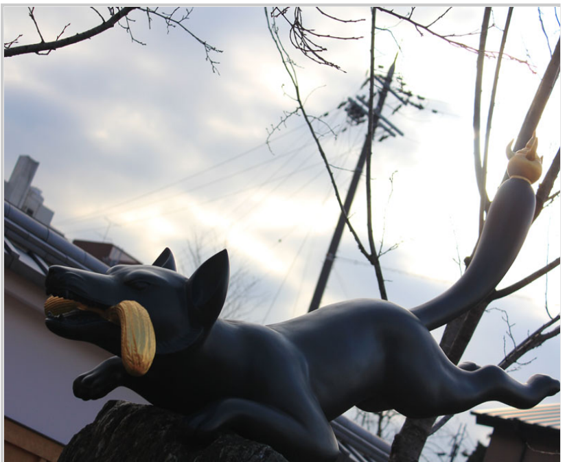
稻荷神的使者-狐狸