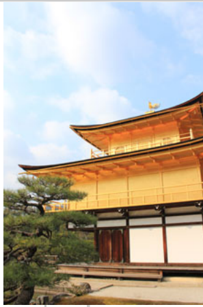
外頭蓋滿金箔・大名鼎鼎的金閣寺舍利殿