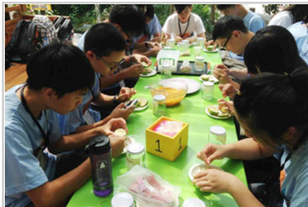
宜蘭幸福20號農場，地瓜圓與果醋DIY

本屆的主題是「Compass—穿越地圖的框限」，希望鼓勵學員走出自己的舒適圈，以冒險的心突破極限，探索新的未來。課程安排「用心看世界」，老師以各地的語言和建築，來說明世界歷史發生的脈絡；「戲劇工作坊」讓學員閉上眼睛，以肢體感官來感受外界的刺激；「良心戰爭」則以哲學的角度探討道德標準與文化衝突；電影欣賞及座談討論到廢除死刑及女性身體權益的問題；還有用樂曲引導認識美國音樂劇演變的課程；「白色巨塔悄悄話」演說更一窺醫生面對醫療問題的內心世界。