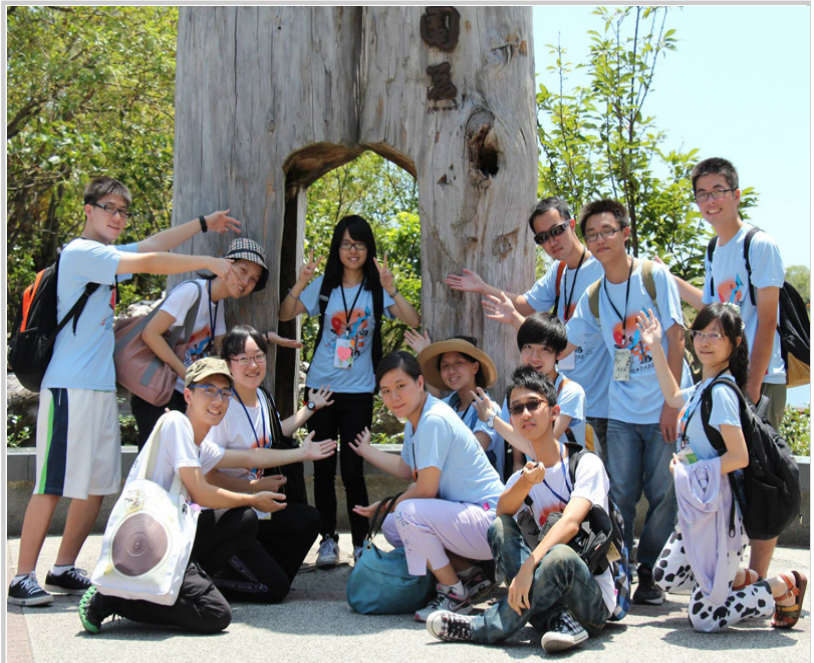
• 采風出遊—羅東林業農場