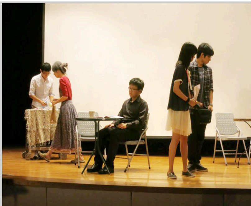
迎新晚會影像劇—《臨·界》