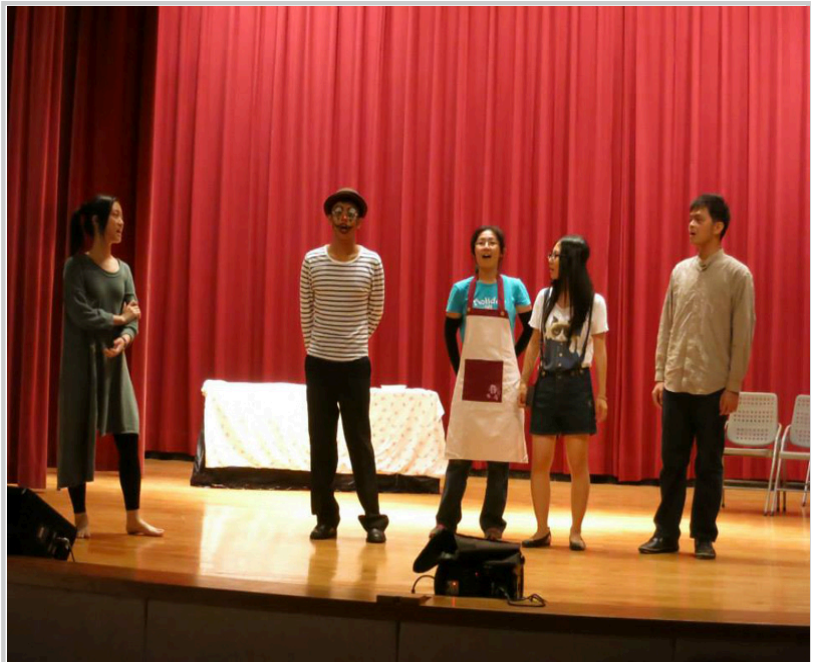
迎新晚會音樂劇落日火車站