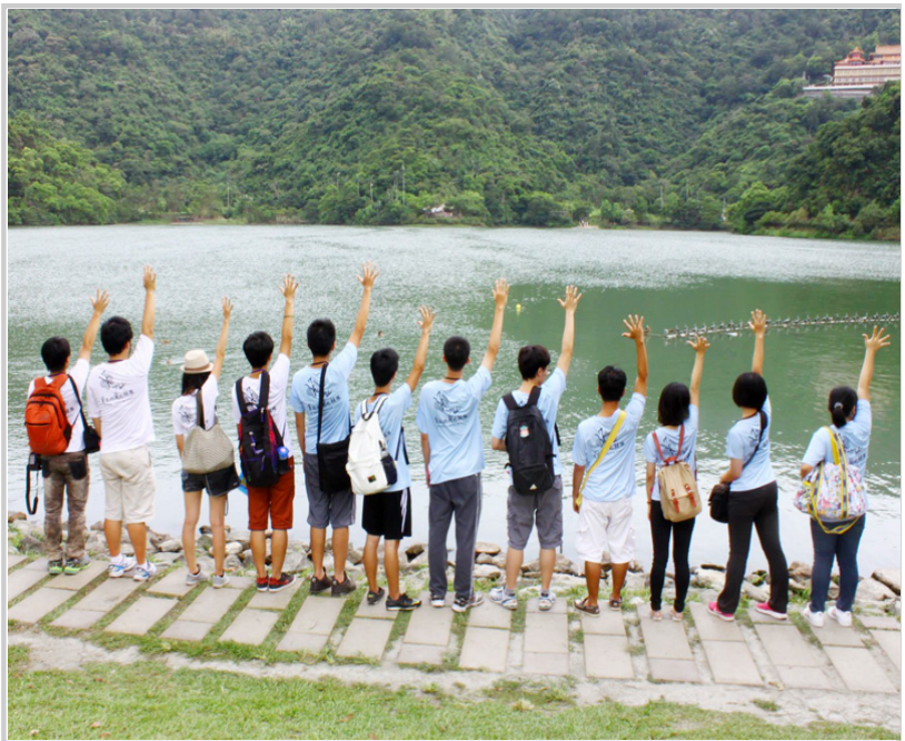
采風出遊—宜蘭梅花湖