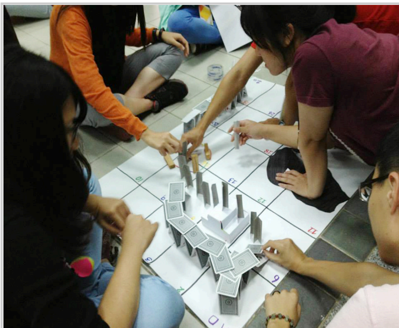
• 晚間活動—智慧鐵人