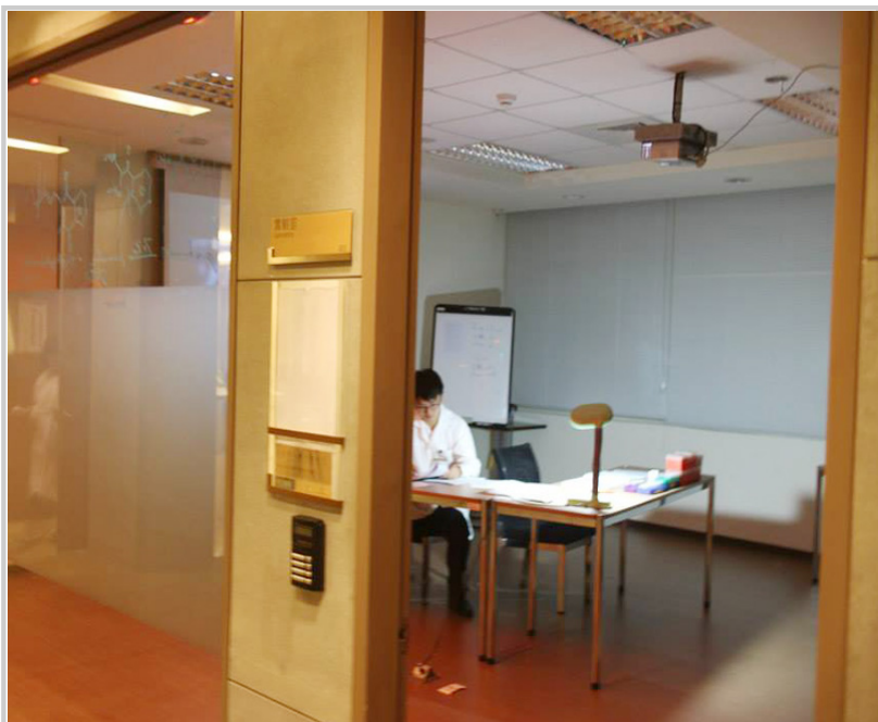
迎新晚會實境劇—《操縱組》