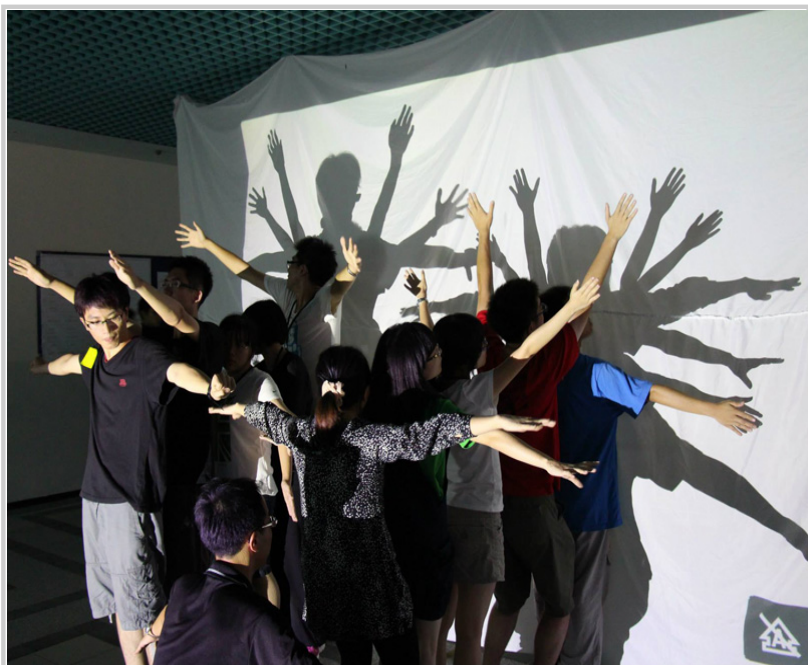
• 晚間活動—大動遊戲