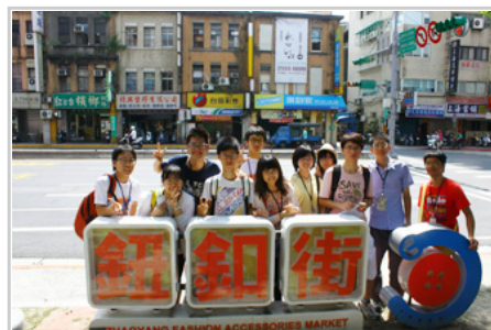
台北故事獵人—大稻埕鈕扣街

為了喚起人文的價值思維，建立對人文的學習和關懷。「陽明大學第17屆全國人文醫學營」於7月21日至26日在本校舉行。共有來自全國不同科系的大專院校90名學生報名參加。人文醫學營隊以主題演講方式進行講習研討，並有工作坊、采風之旅、「台北故事獵人」、讀書會等活動。希望透過不同方式，讓學員們重新認識周遭環境、文化、歷史，在知識中學習人文關懷，建立以「人」為中心的價值觀。