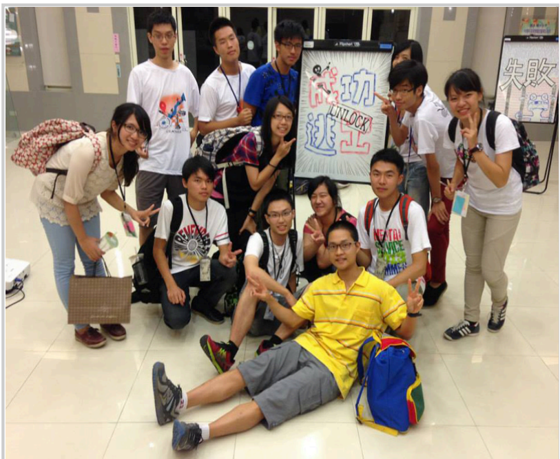
晚間活動—密室逃脫