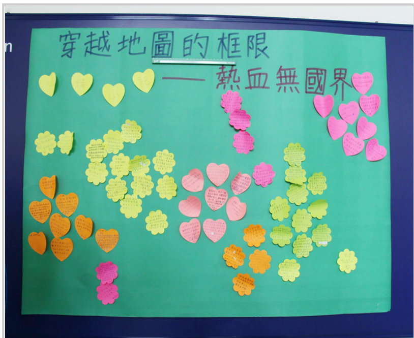
演講心情小語—每場演講後可在便利貼上寫上心得，與大家共享