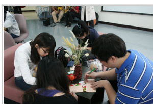
同學們在寫感恩卡

最後學務處安排同學朗讀張曉風所寫的一篇文章～「謝謝你，曾活得那麼漂亮」。這是張老師緬懷過世的創校韓偉院長所寫下的文章。文內描述韓院長推行校務，堅持原則，不畏懼壓力與批評，生病時立刻辭去院長之職，深怕耽誤學校發展。張曉風老師懷念韓院長的信守承諾、正直無私，也感謝他為陽明留下榮譽的傳統與典範。