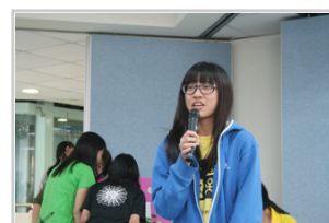
同學上台發表感言