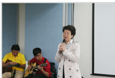
姜學務長勉勵同學

接著由20位多同學上台分享感恩心得。有的學生感謝室友，開誠布公的與她相處並傾聽她的心聲。視覺文化研究所今年成立第一年，該所的同學上台表示，全所只有5位同學，大家感情很好，相互照顧。有學生說自己很「宅」，整天只會在臉書上跟人聊天。但是當他北上讀書，找不到房子時，卻有同學請他到家裡去住，讓他很感動，也更樂於與人互動。還有同學感謝老師，讓他學會獨立思考，也協助他生涯規劃。